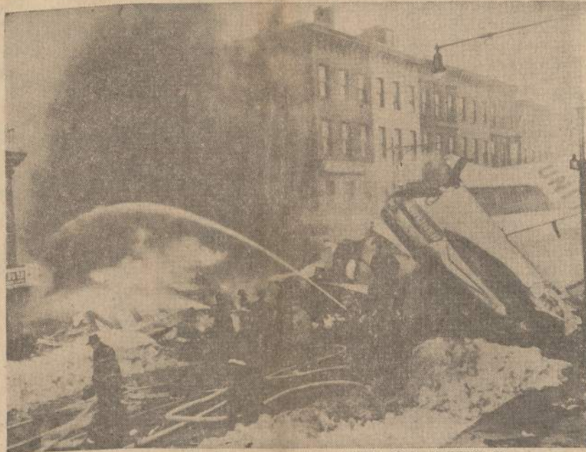
Gaisrininkai prie Brooklyno (N. Y.) gatvėje nukritusio DC-8 srausminio lėktuvo, kuris, pūgai siaučiant, susidūrė su kitu lėktuvu. Nelaimėje žuvo, kiek jau žinoma, 136 žmonės.

Anadien kariuomenės teismas laivyno mašinistą nubaudė, bet palyginti švelniai, pažemino laipsnį ir atims iš algos $25 kas mėnesį, kol sumokės $150 baudą.