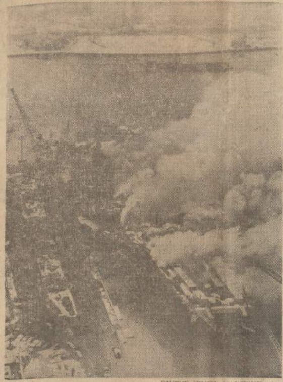
Lėktuvnešis Constellation užsidedęs Brooklynso uoste. Gaisro dėmai užtemdė Manhattaną.

— Lietuvoje gaminami specialūs mikrovarikliai. Lietuvoje veikia dvi specializuotos, mažo galingumo variklių gamyklos: "Elfa" ir Mažeikių elektromechaninė gamykla. Pereitais metais jose pagaminta daugiau kaip 900,000 mikrovariklių, sekančiais metais gamyba numatoma išplėsti 2,500,000 vietų į metus. (E)