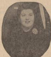
Lorraine Bezak Lygos Prezidentė