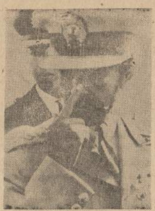
Etiopijos imperatorius Haile Selassie grįžęs iš Pietų Amerikos kalba į savo sesinties Adis Abebos piliečių būrį, kai sukilimas prieš jo sotą buvo nuslopintas.

Rašo besveikatis iš sanatorijos Nuoširdžiausia dėkoju už švenčių sveikinimus, linkėjimus ir mielą žaliuką. Kalėdos ir Vokietijoje yra viena didžiųjų metų švenčių. Ši šventė rišasi su sveikinimais, linkėjimais ir dovanomis bei dovanėlėmis. Turtingieji perka puošnias, brangias dovanas, pasiturintieji menkesnėmis tenkinasi, o vargšai dar menkesnėmis. Bet visi ką nors ta progą perka. Mes besveikaciai, ligoniai sanatorijoje Kalėdų progą gauname iš organizacijų marškinių, kojinių, vaisių, sviesto, saldainių ir kitokių gėrybių. Bet mes irgi nesame laisvi nuo teikimo dovanėlių savo keliu. Be sveikinimo turime ką nors nupirkti gydytojams, seselėms, slaugėms, slėvėjams. Tas atliekama sądėtinai. Tam reikalui mes pacientai dedame po tiek, po kiek išgalime. Šie iš mus, žinoma, nieko ypatingo nesitiki, jie gal ir nenorėtų, kad mes jiems bent ką pirktumėm, bet tas daroma