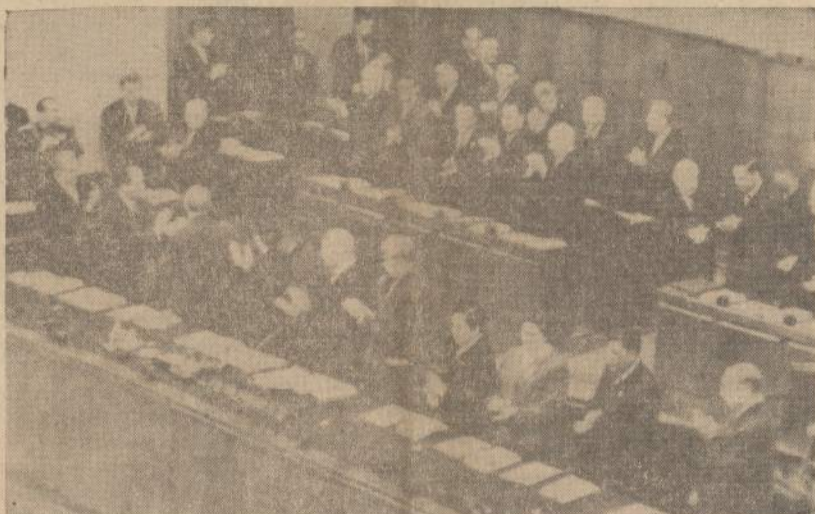
Nikita Chruščiovas (prie stalo centre, iš dešinės), po ilgesnio laiko negalavimo, pirmą kartą viešai pasirodė SSSR aukščiausiojo sovietinio žurnalo atidaryme Maskvoje. Pirmojoje eilėje (antras iš kairės) Aleksiejus Kirilenko, šį pavasarį pavyrėtas iš partijos prezidentumo, bet matyti vėl atsiderė malonėje.