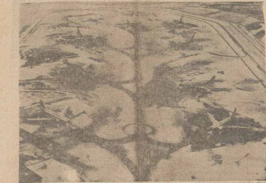
Strateginės oro vadovybės B-52 sprausminiai bombonešiai ir KC-135 sprausminiai tankeriai sudaro "Kalėdų eglutę" Ellsworth oro jėgų bazėje, kuri yra netoli Rapid City, S. Dakota.

Pabaltiečių ir kitų svetimšalių jaunimo koncertas Koelne. Gruodžio 18 d. Koelne, Belgij rėmuose, įvyko pabaltiečių, vokiečių (Deutsche Jugend des Ostens) ir vengrų jaunimo parengimas-koncertas, kurio prasmė buvo: padėkoti už rūpinimąsi pabėgėliais, ypač jaunimu. (E)