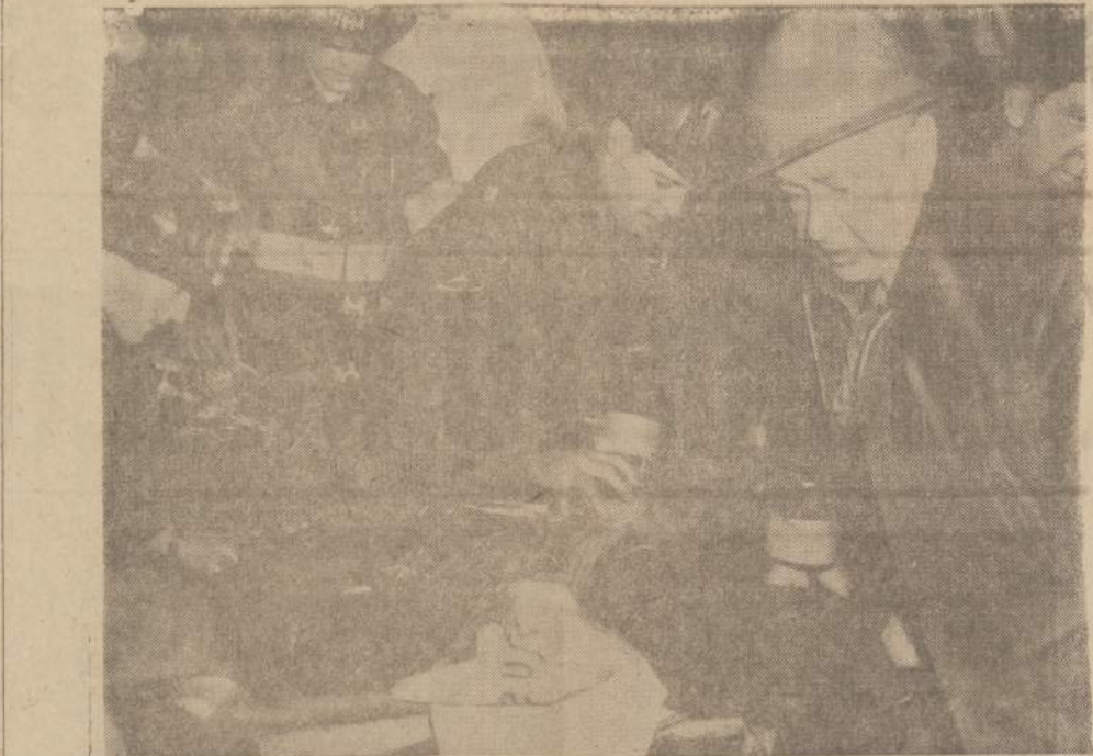
Gaisrininkai hėia iš deganėio lėktuvnetio Constellation viena užtroėusį jėrininką. Gaisro aukos iš lėktuvnetio buvo gabenamos prie laivo kraėio ir reikiėiuose nuleidžiamos ant melų ir iš čia ambulanėiais gabenos į ligonines. Nukentėjusiems pirmoji pagelba, kaip tai deguonis, buvo teikiama dar beneėiai į ambulansus.

Ko vertos studentų korporacijos Architektas Arbas reišė teigiamą nuomonę apie dabartinį,