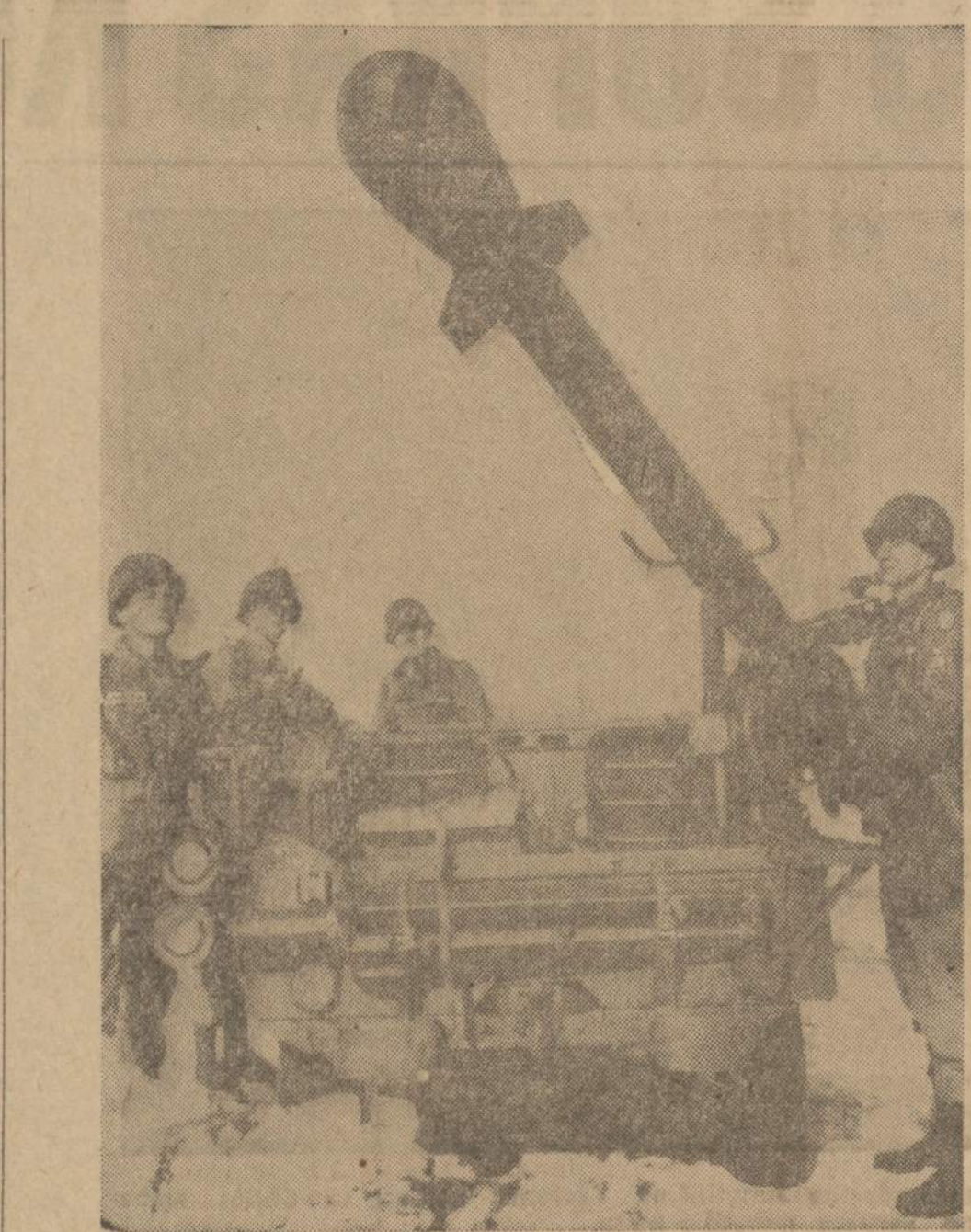
Naujos rūšies branduolinių ginklų, kuriuos galima vežti "džupu". Nors tie ginklai yra mažukai, bet pasižymi dideliu pajėgumu. Be to, jų ginklų išsiančiamos atominės bombos nėra labai pavojingos civiliams gyventojams, nes jų radioaktingumas yra labai mažas.