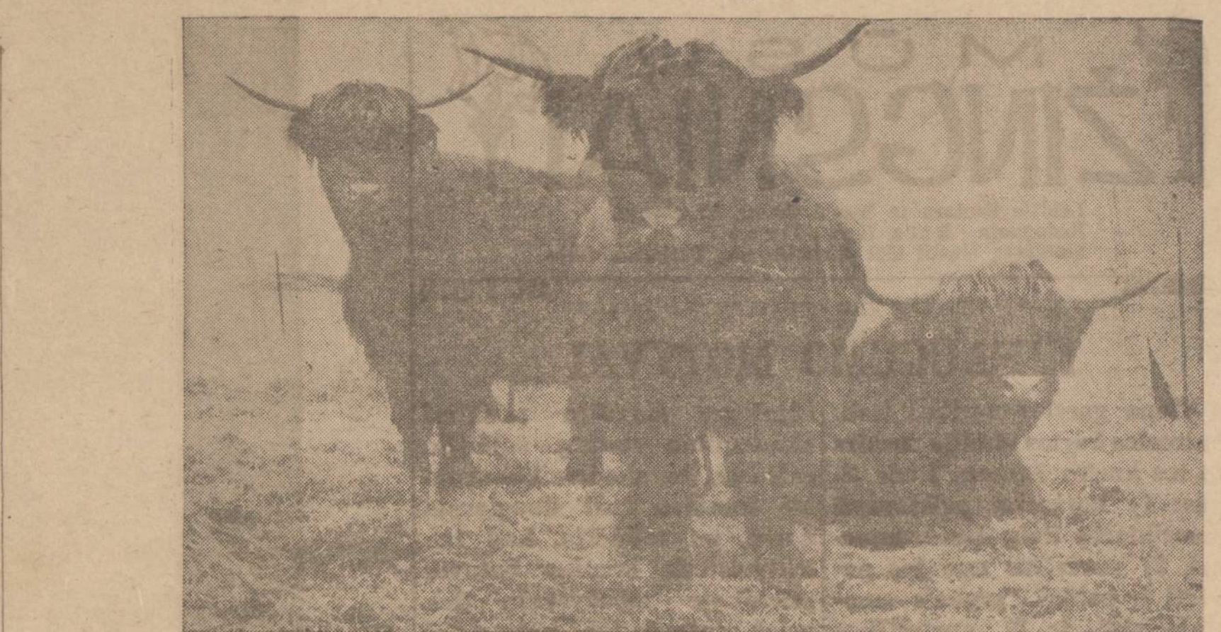
Scotch Highlander galvijai lengvai pakelia ilgą šaltes žiemas. Ilgi ir tankūs plaukai apsaugo galvijus nuo šalčio, lietaus ir sniego. Tie galvijai nuo priešistorinių laikų klajojo po škotijos kalnus. Jų mėsa, sakoma, yra gana gera ir gardi. Ši trijųjų yra dalis "Anne's Acres" fermos kaime. Farma yra netoli Wausau, Wis.

Nepriklausomoje Lietuvoje 1924 m. įstatymu nustatė Lietuvos dvarų kumečiams tokį atlyginimą: 1) 180 litų pinigais, arba dabartinė bolševikine valiuta 1800 rublių; 2) 1850-1700 kg javais, taigi apie 6 kg už darbo dieną; dvaras turėjo duoti ganyklą ir pašarą dviem karvėm, 2 avim ir pelų dviem kaulėm; bulvėms, linams, dar-