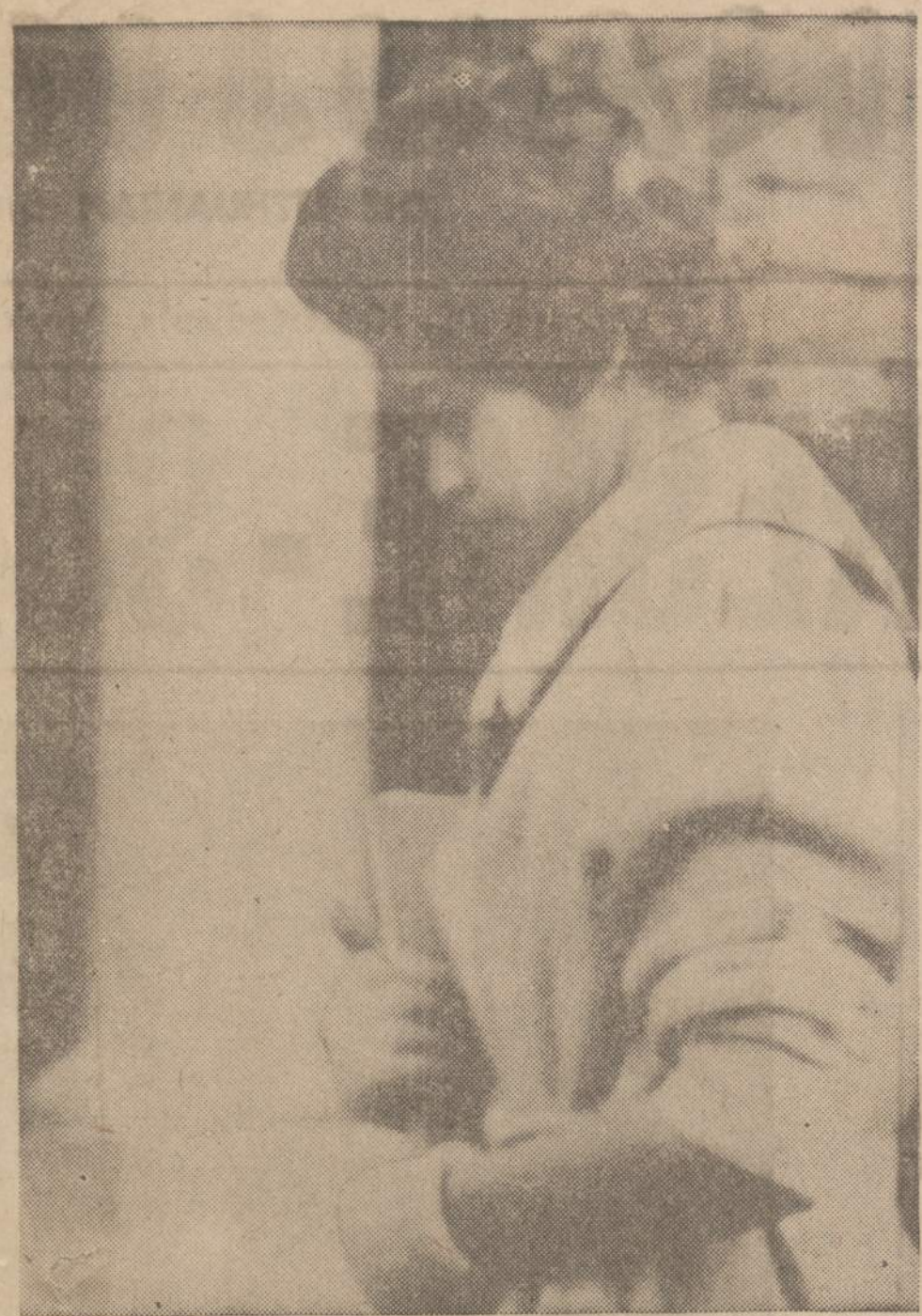
Charlayne Hunter, nuleidusi galvą, gryžta į Georgia universitetą, esantį Athens, Ga. Ji ir Hamilton Holmes (abu yra neigrai) buvo suspenduoti, kai įvyko studentų riaušės.

"NAUJIENOS" KIEKVIENO DARBO ŽMOGAUS DRAUGAS IR BIČIULIS