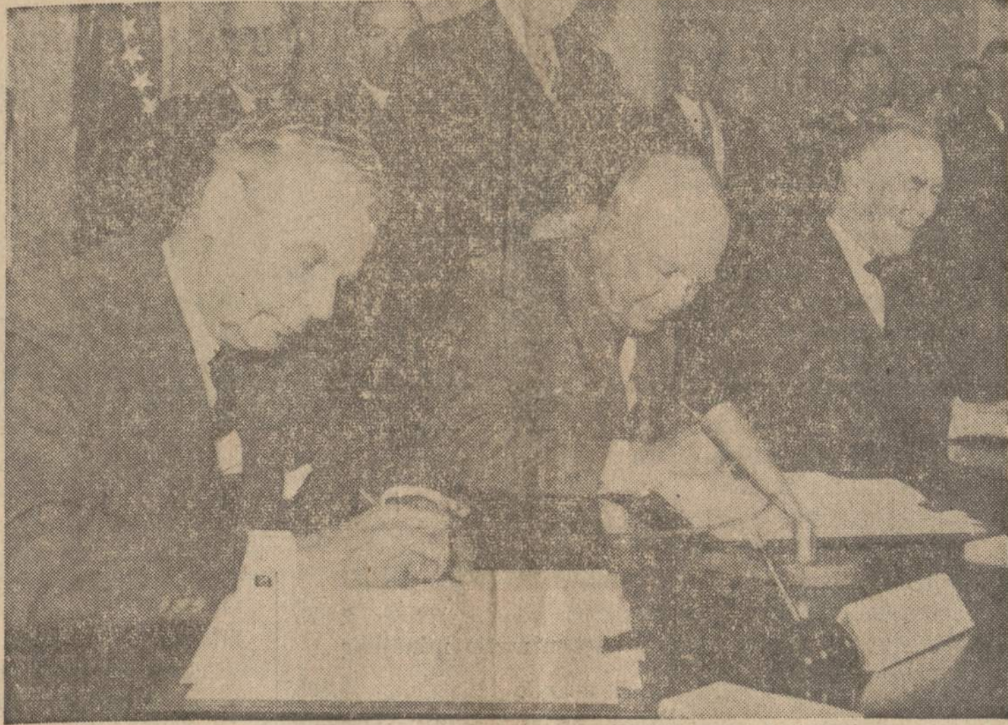
Prezidentas Eisenhoweris ir Kanados premjeras John C. Diefenbakeris pasirašo Washingtono sutartį dėl Kolumbijos upės baseino išvystymo. Dešinėje valst. sekretorius Christian Herter.

Jei ne, mes griebsimės rimtų priemonių. Mes esame nusistatę pasirašyti taikos sutartį su Rytų Vokietija ir galiausia ištraukti iš Berlyno tą erkšketį — Vakarų šalių okupaciją.