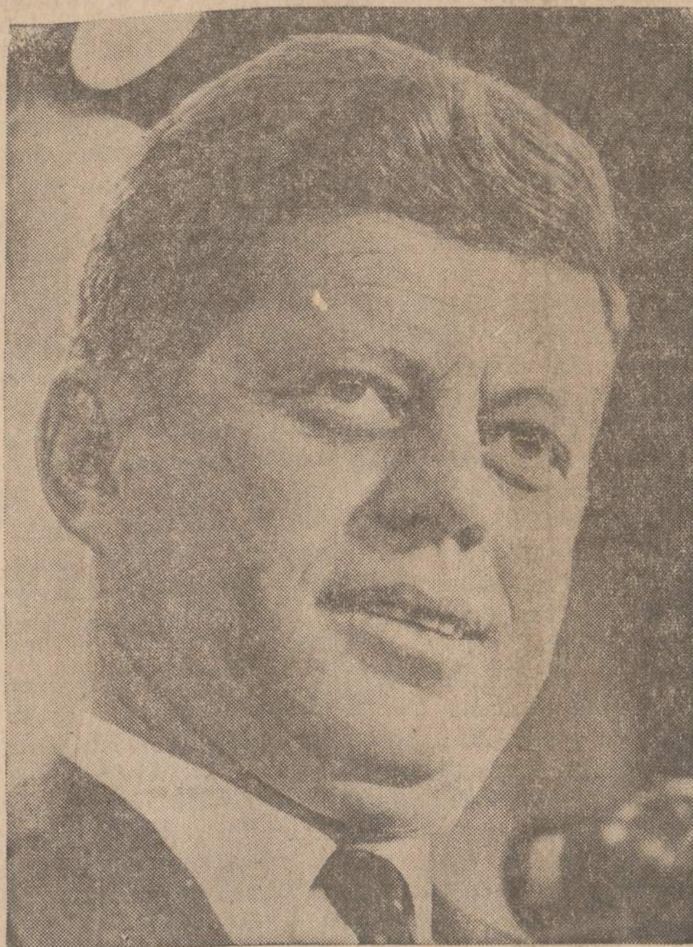
PREZIDENTAS JOHN F. KENNEDY

Jis yra JT specialus igaliotinis, taikos misijos galva. Kasavubu skundėse nekarta, kad Dayal simpatizuoja buvusiam Kongo premjerui prokomunistui Lumumbai.