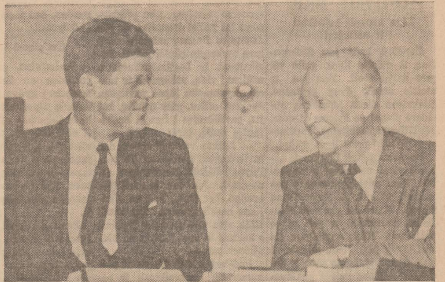
Naujasis prezidentas John F. Kennedy ir apleidžias prezidento postą Eisenhoweris tariasi Baltuosiose Rūmuose.

Patį stipriausioji užsieniečiams gelbėti amerikiečių organizacija 1960 m. buvo NSWC