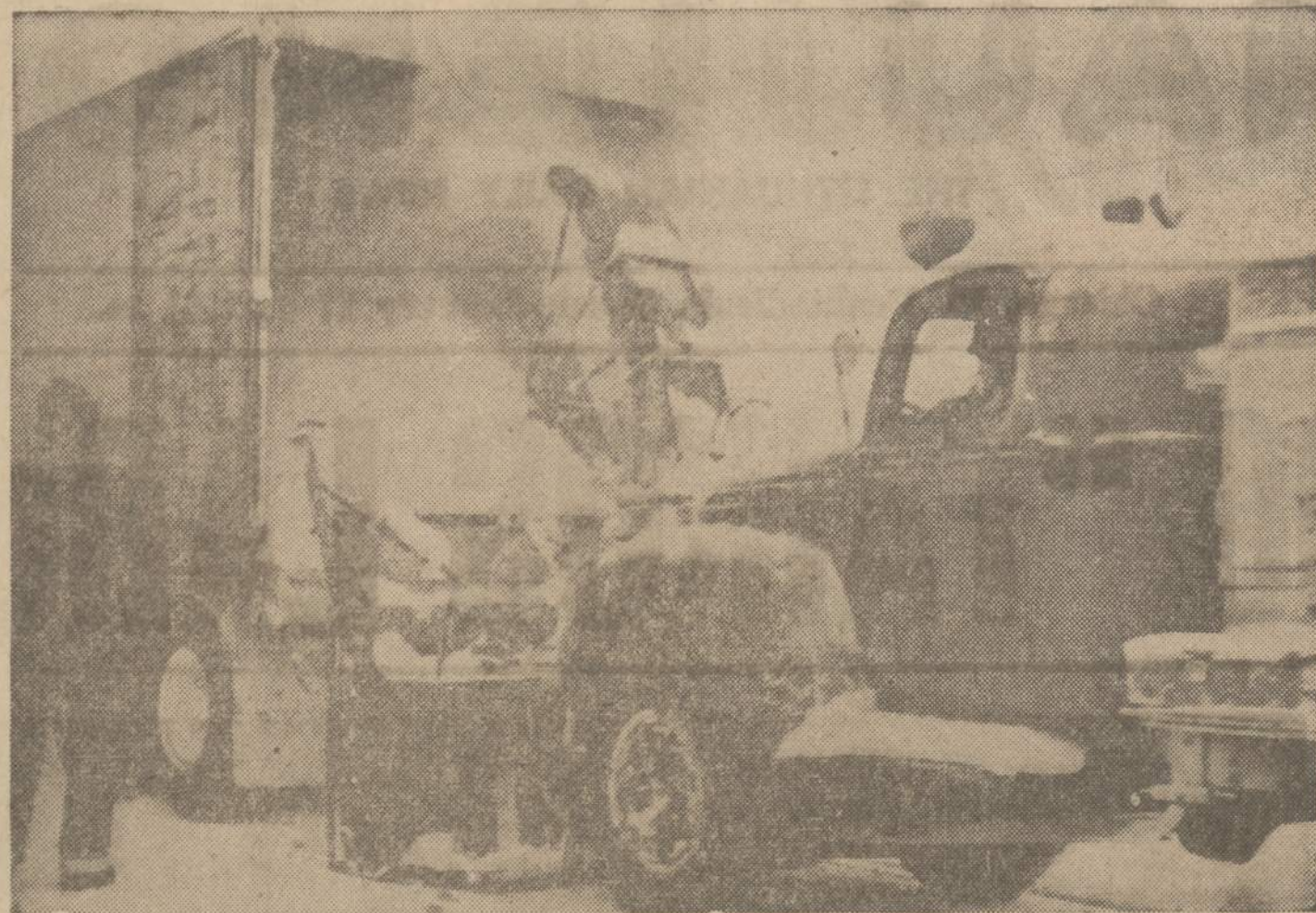
Sniegas už pinigų perkamas. Snowflake Ski klubas bei Wesley, Wisconsin, savo ruošiamam slidinėjimo sporto turnyrui pirkė sniegą iš Hurley, Wis., už 250 mylių atstų į šiaurę. Prie Wesley sniego kaip ir nebuvo. Už sniegą patį nereikia nieko mokėti, tik už pakrovimą ir atvežimą.

Baigdamas šias trumpas apžvalgas pastabas, kurios šiame skyrelyje jau ne pirmą kartą minimos, siūlau, kad lengvosios atletikos komitetas ar vienas stipresniųjų klubų (su prieaugliu) imtųsi iniciatyvos šiuo skubiu klausimu sukviesti