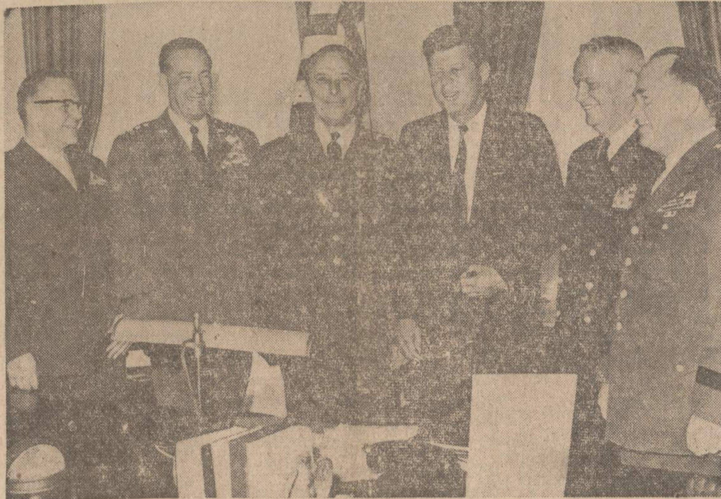
Prezidentas John F. Kennedy savo ofise Washingtono drauge su vyriausiojo štabo nariais, kurie jį aplankė pirmą kartą. Iš kairės dešinėn: Generalas David A. Shoup, marinių korpuso komendantas; gen. Thomas D. White, aviacijos štabo viršininkas; gen. Lyman L. Lemnitzer, jungtinio štabo viršininkas; prezidentas Kennedy; admiralas Arleigh A. Burke, laivyno operacijų viršininkas, ir gen. C. H. Decker, armijos štabo viršininkas.