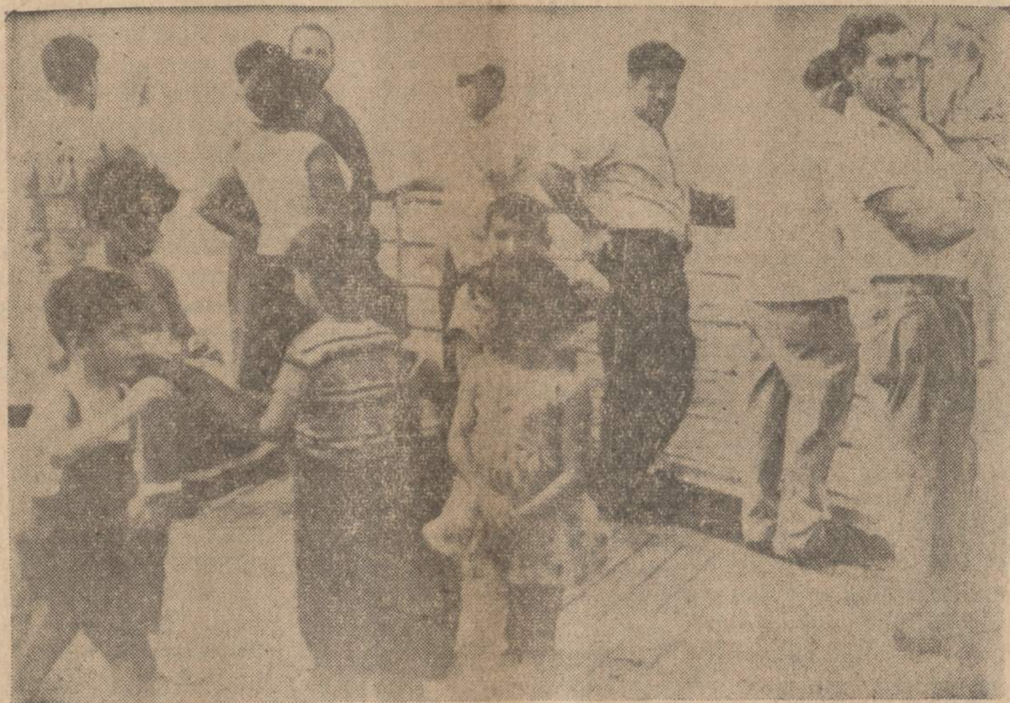
Grupė žmonių iš 620 keleivių portugalų laive Santa Maria, kurį pagrobė Portugalijos diktatoriaus Salazaro politiniai priešai.

Kubos pabėgėlių šalpos programos direktorium paskirtas Dillon Myer, buvęs tarp-ameri-bus reikalų instituto vedėjas. Karo metu jis rūpinosi internuotais japonais (jų buvo 110,000