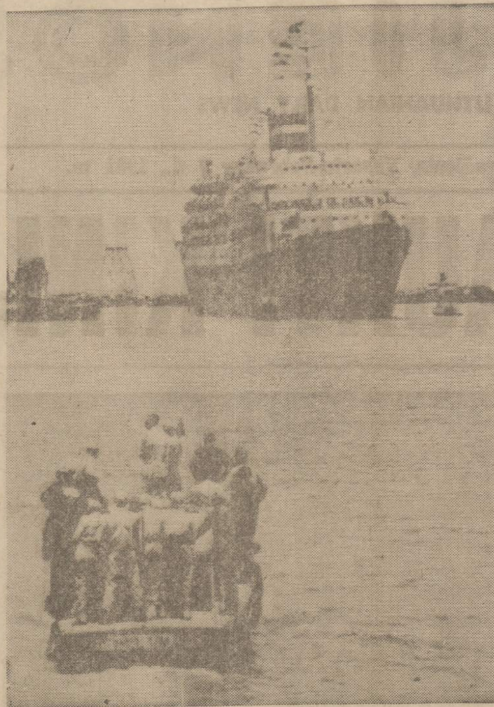
Brazilijos kariuomenės sargyba, valtise apsupusi portugalų Santa Maria laivą įlankoje prie Recife, laukia, kol laivas įplauks į uostą, kur galės būti išlaipinti į krantą daugiau kaip 600 kėselvių, kuriuos suklijėliai išlaikė laive per 12 dienų.