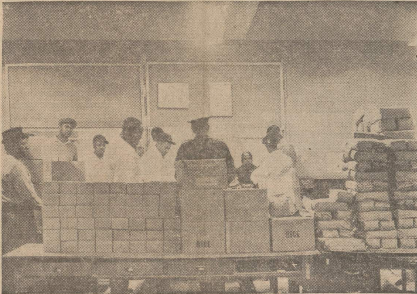
Detroito bedarbiai, sustoję į eilę, laukia maisto produktų. Pagal federalinės valdžios patvarkymą, valdžios maisto išteklių (kukurūzai, miltai, pienas, taukai ir ryžiai) yra dalinami tose srityse, kurios yra daugiausia nedarbo paliestos. Illinois, Michigan ir dar kitos trys valstybės priklauso tokioms sritims, nes ten daug yra bedarbių.

Vyriausybė karts nuo karto išskeldavo didžiosioms kompanijoms bylas už slapty kartelių sudarymą, kas yra priešinga laisvos konkurencijos principui. Bet kompanijos dažniausiai nuo baudos išsisukdavo. (E)