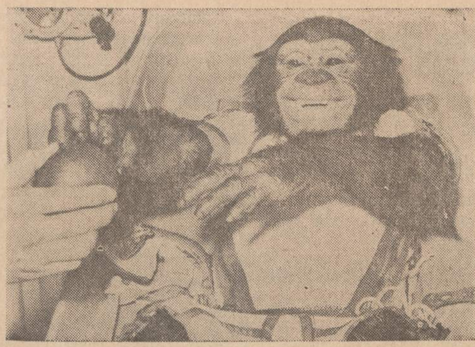
Iš dangaus grįžusi beždžionė Ham gavo didelį raudoną obuolį. Kapsulėje uždaryta, ji buvo išauta raketėje iš Cape Canaveral ir iškliusi 155 mylių į erdves. 5000 mylių greičiu nuskrido 420 mylių, nusileido parašiutu į vandenyną, kur helikopteris ją su visa kapsule iškėlė.

šimą, tai Antrąją Dainų Šventę. Pirmoji JAV ir Kanados lietuvių dainų šventė sutraukė apie 10,000 tautiečių ir sulaukė atsiliepimų amerikoniškoje visuomenėje. Apie ją rašė ne tik Čikagos amerikoniški laikraščiai. Pasisekimas buvo didelis, nors šventė ir turėjo gerokai paprakai tuoti, nesant salėje vėsinamos oro sistemos. Antrajai Dainų Šventei gauta Čikagos Amphiteatro salė, kur vėsinamas oras įgalins užmiršti, kad ir didžiausias, karščiūs. Taip pat, yra didelis automobiliams statyti plotas, tat svečiams nebus vargo, ieškant vietos savo "vežimams" pasistatyti. Patarnavimas žiūrovams, norintiems atsigauti geriamais ar saldumynais, neverčiant atsisoti iš savo vietų, gal ir buvo lemiantis veiksnys, kad