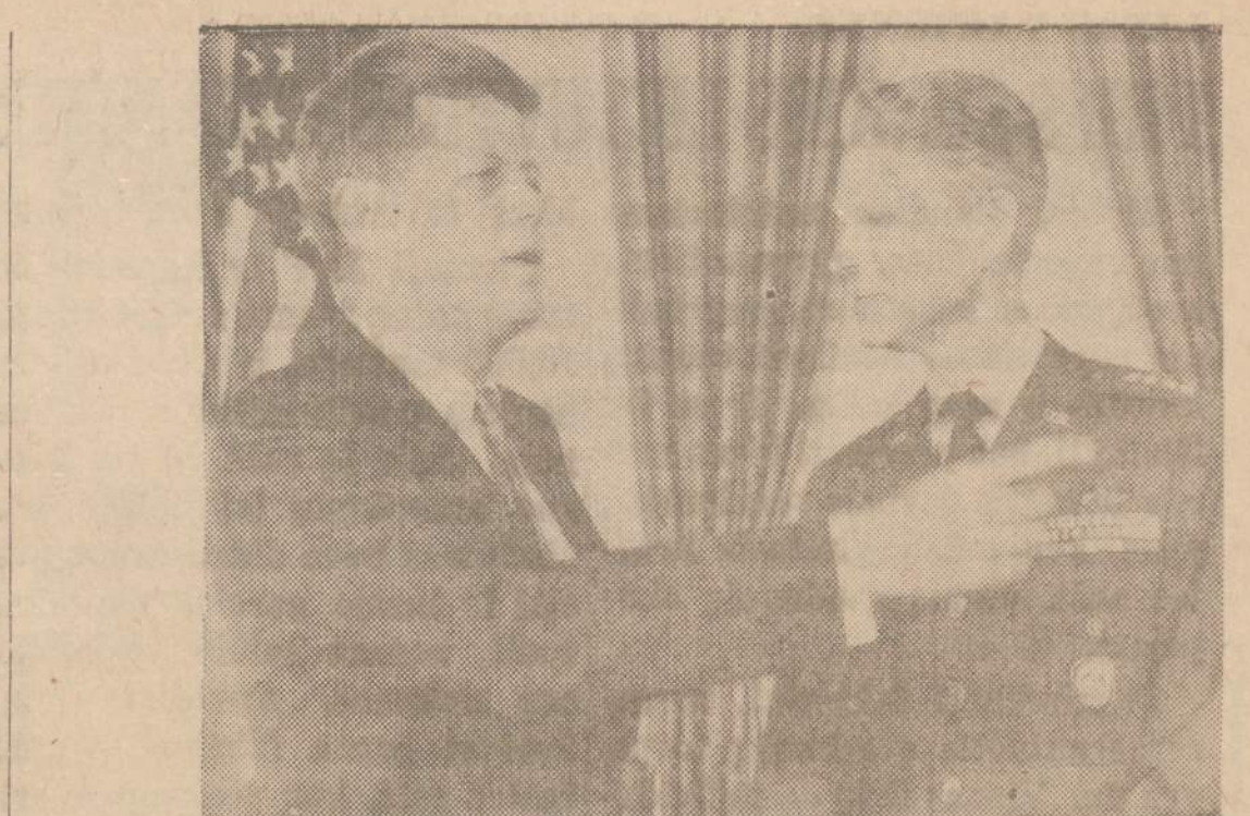
Prezidentas Kennedy kalbasi su Nato vyriausiu vadu, Lauris Norstad, kurs buvo atvykęs pasitarimui į Baltuosius Rūmus, Washingtono. Po pasitarimų buvo paskelbta, kad Norstad ir toliau pasilieka Nato karinių pajėgų vadu.

Neužmirštas liko ir milijono klausimas. Plačiau šiuo klausimu kalbėjo, milijono minties