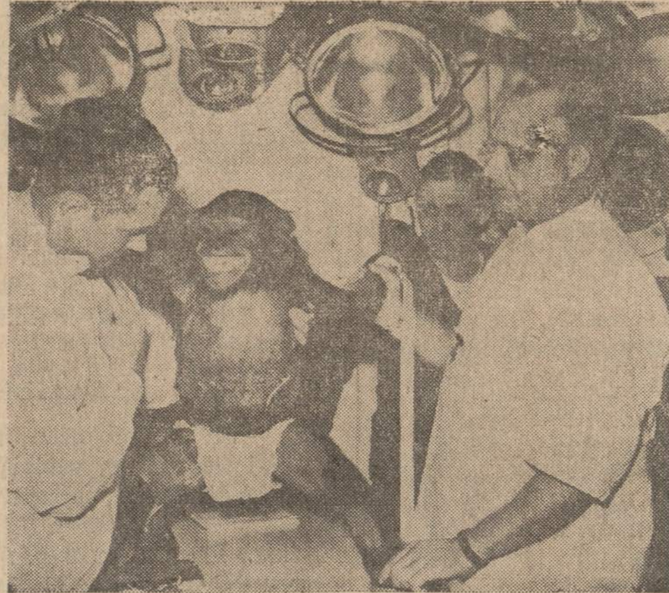
Erdvių keliautoja beždionė Ham, ka tik grįžusi iš erdvių ir helikopteriu iškelta iš vandens, visa burna laimingai šypsoi, atgabenta į laivą.

BIZNTERIAI, KURIE GARSINASI "NAUJIENOSE" — TURI GERIAUSIA PASISEKIMA BIZNYJE — GARSINKIS IR TU