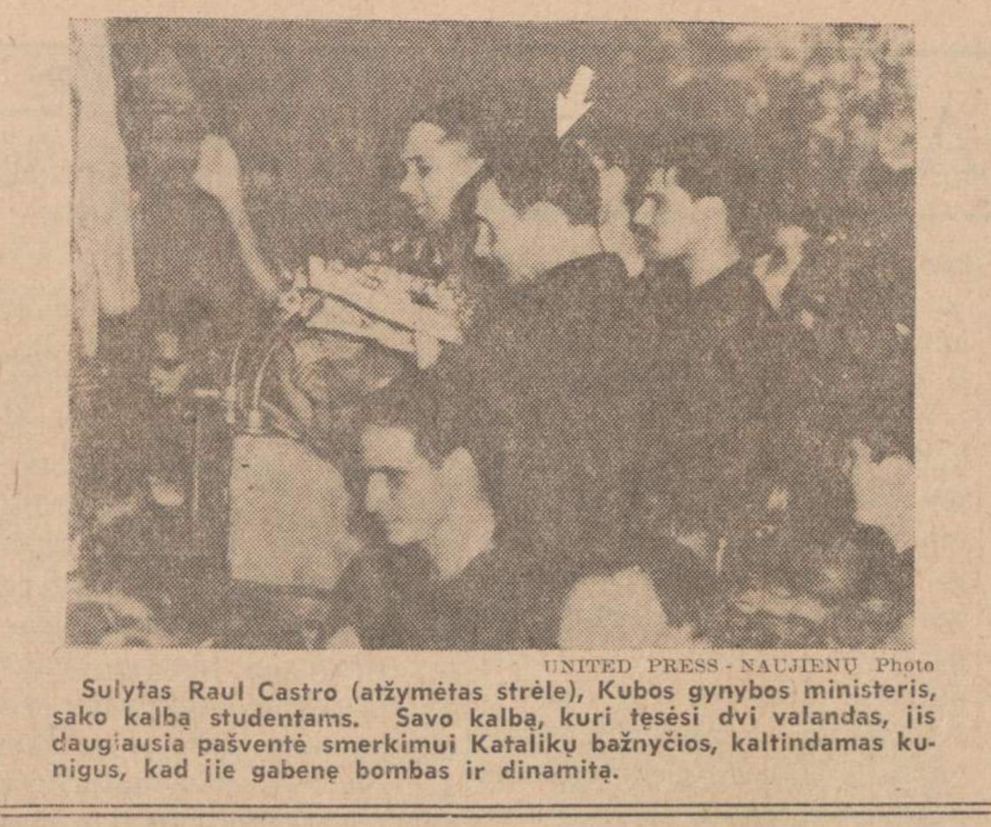
Sulytas Raul Castro (atžymėtas strėle), Kubos gynybos ministras, sako kalbą studentams. Savo kalba, kuri tęsėsi dvi valandas, jis daugiausia pašventė smerkimui Katalikų bažnyčios, kaltindamas kunigus, kad jie gabena bombas ir dinamitą.