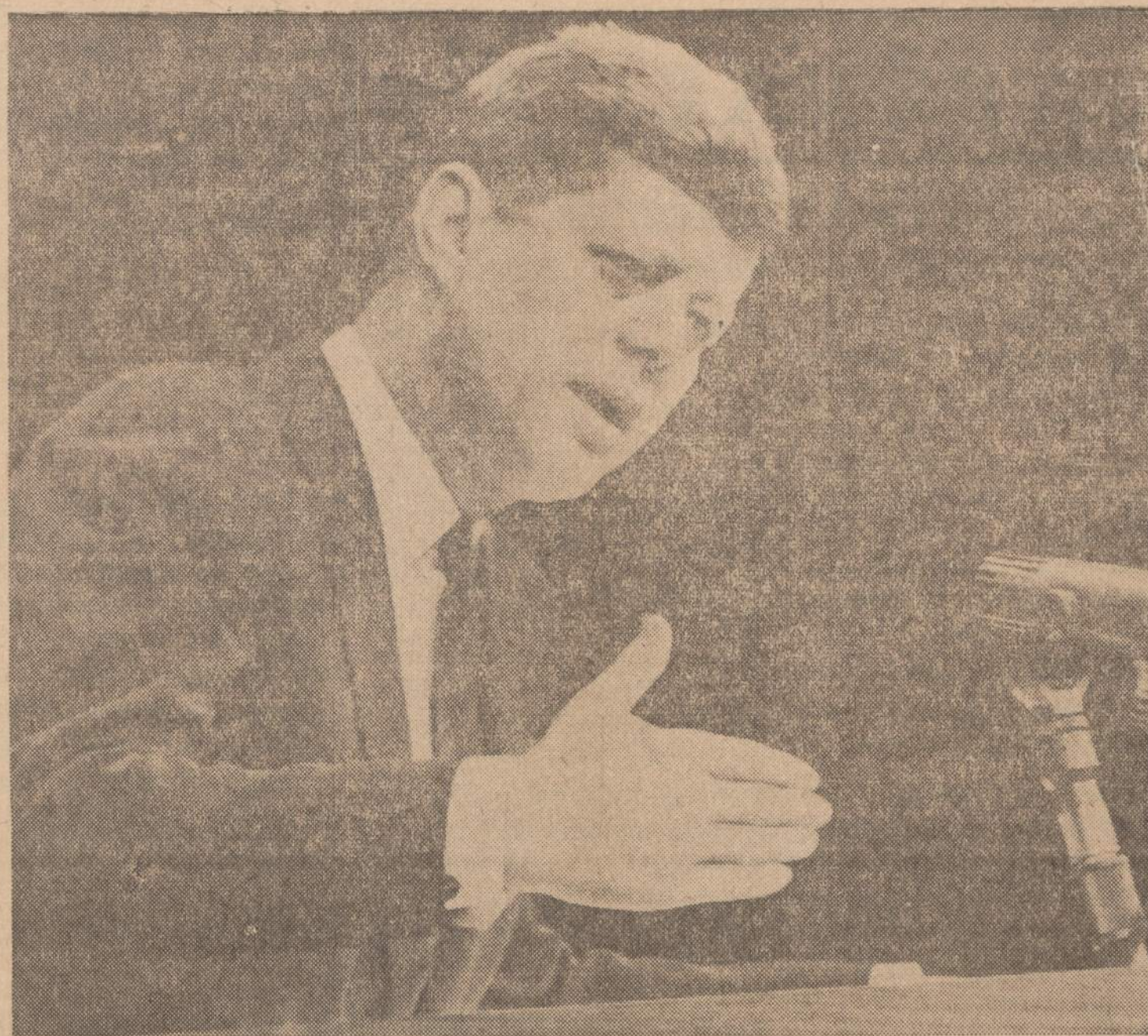
Prezidentas Kennedy spaudos konferencijoje pareiškė, kad iki šiol jis dar neturi tikrų duomenų apie tai, katra valstybė raketų srityje pirmauja, — JAV ar Sovietų Rusija.

gų farmų, — turtingų ir didelių. Gyvulių bandos jau vien juodų, žalmargių ir kitokių spalvų karvių. Aišku, atgabentos iš šiaurinių valstijų ir prijaukintos čia. Ir maistas joms atitinkamas. Išartoje žemėje pasėta žolė alfa-alfa ar kas panašaus. Kai kur mažesniuose ūkiuose matyti vietinės veislės plačiaragių karvių.