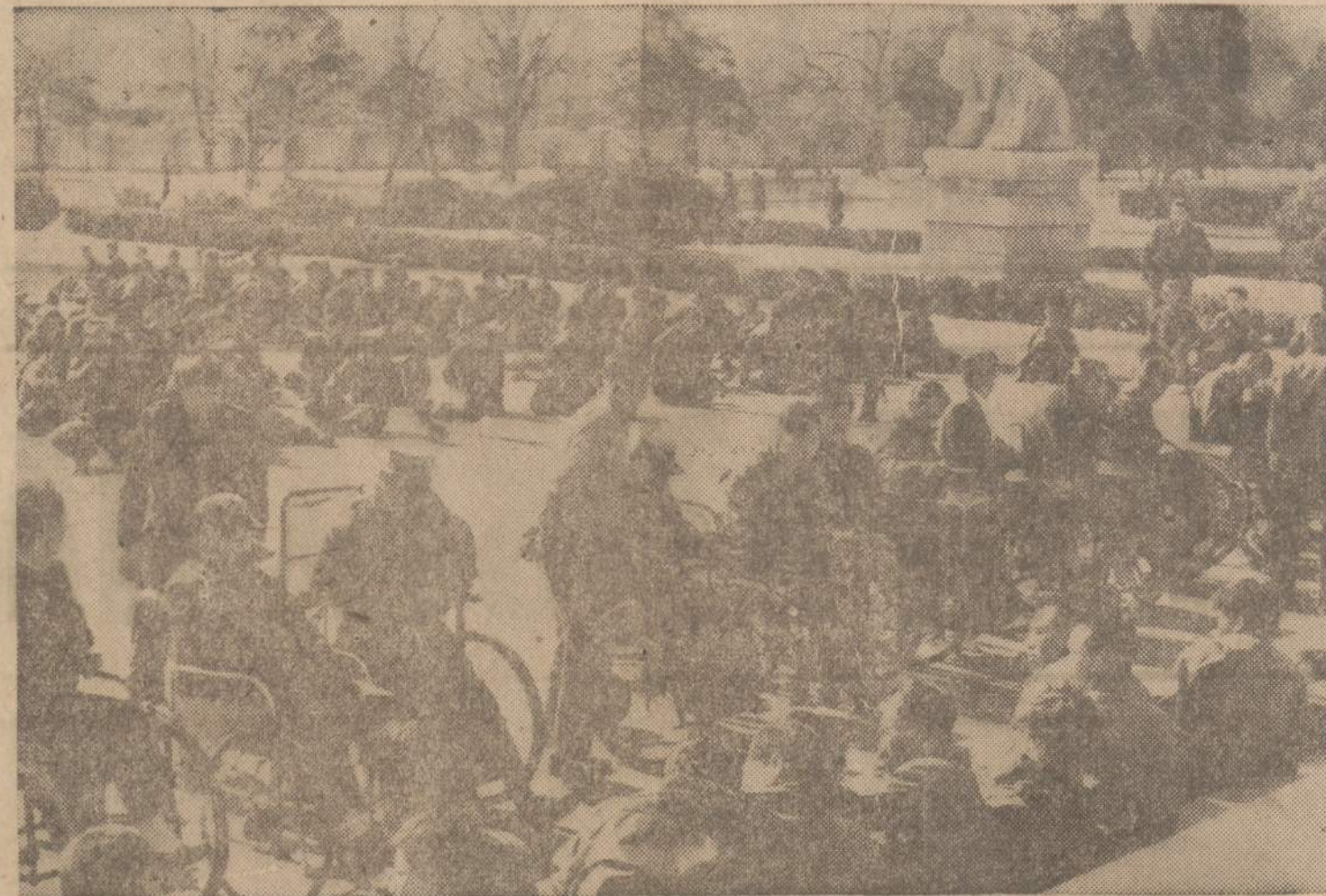
Seoul, Korėja. — Apie šeši šimtai Korėjos sužeistų veteranų reikią protestą, sėdėdami per visą naktį. Jie reikalauja, kad valdžia padidintų jiems teikiama paramą.