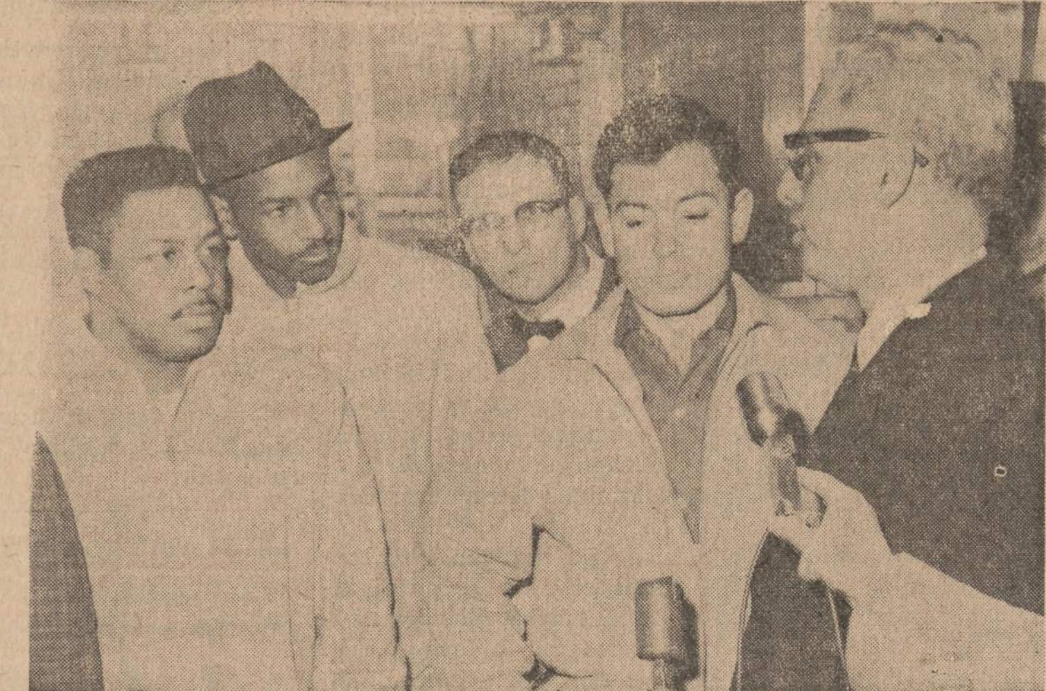
Darbo sekretorius Arthur Goldberg bando daugiau patirti apie labiau nedarbo palieštas sritis vidurinėse valstybėse.

WORLD PARCEL SERVICE 3320 S. HALSTED ST., CHICAGO 8, ILL. YA 7-0677