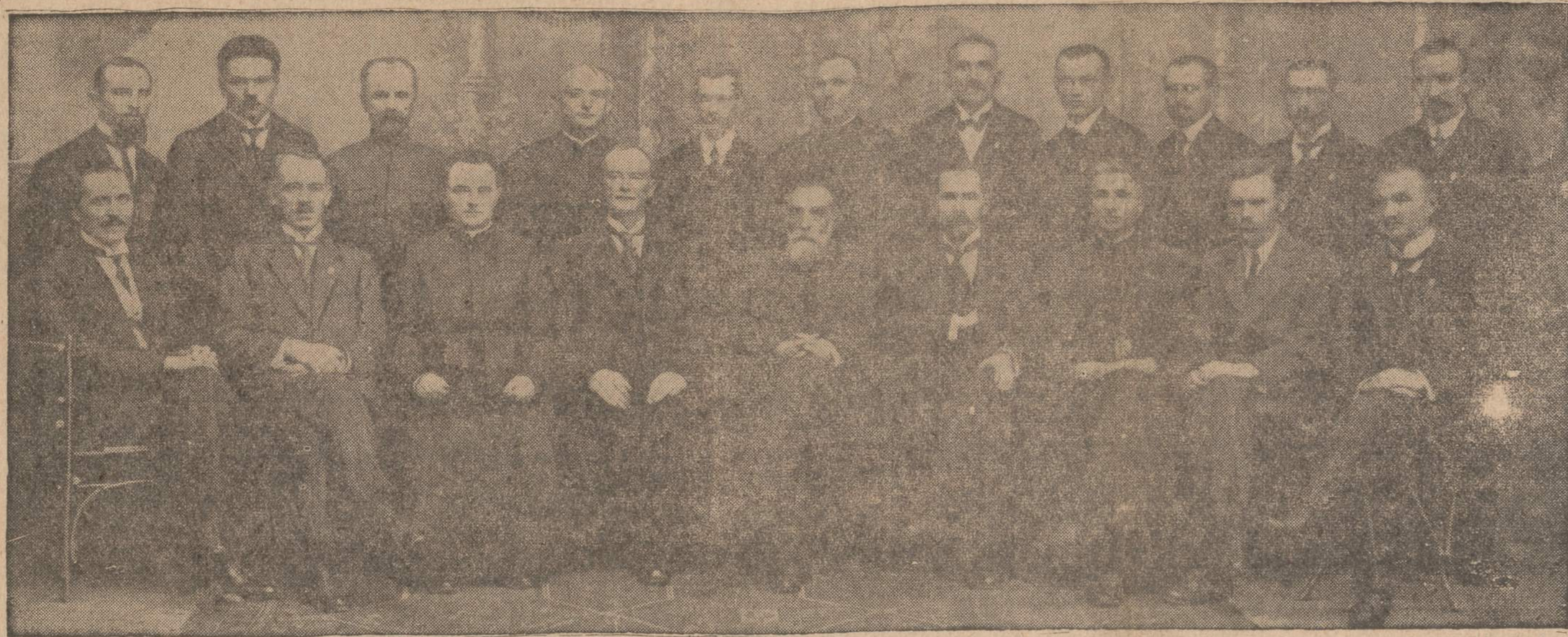
Istorinio 1918 metų vasario 16 dienos Lietuvos nepriklausomybės deklaracijos signatarai. Sėdi, iš kairės į dešinę: Jonas Vileišis, Dr. J. Šaulys, kun. J. Staugaitis, St. Narutavičius, Dr. J. Basanavičius, Antanas Smetona, kun. J. Šaulys, Steponas Kairys, J. Smilgevičius. Stovi, iš kairės į dešinę: K. Bižauskas, J. Vailokaitis, D. Malinauskas, kun. V. Mironas, Mykolas Biržiška, A. Petrusis, S. Banaitis, P. Klimas, A. Stulginskis, J. Šernas, Pr. Dovydaitis.

Prieš 43 metus jie paskelbė Lietuvos nepriklausomybę