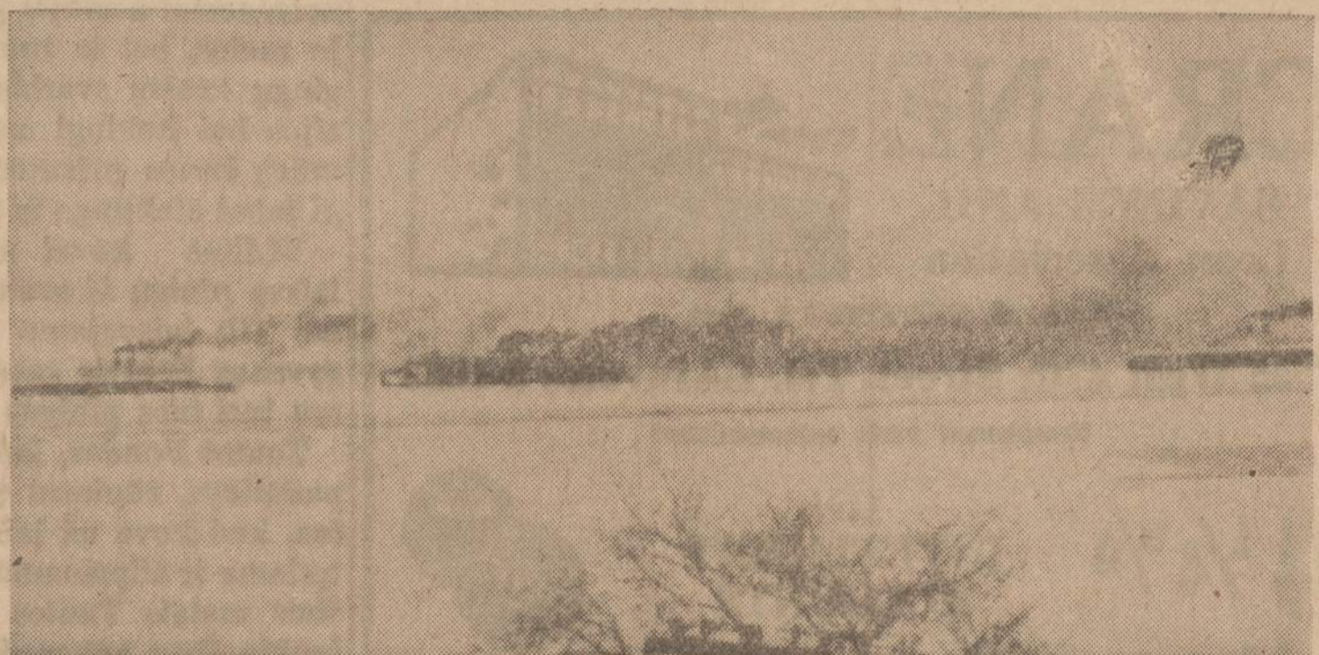
Milwaukee (Wis.) uosto įstrigo į ledus šeši laivai ir negalėjo pajudėti.