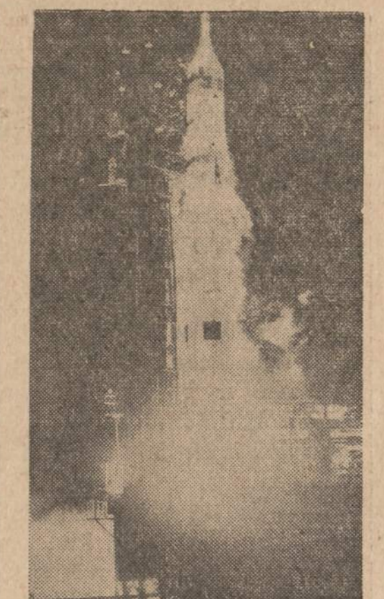
Tarpkontinentinė balistinė raketą Titan paleidžiama iš Cape Canaveral, Fla., į taikini, esantį prie va- karu Afrikos.

University of California Extension praneša, kad pradeda laiškas (korespondencija) kursai JAV pilietybei pasirošti. Tuos kursus paruošė JAV Teisingumo Depart. Imigracijos ir Natūralizacijos Tarnyba tiems asmenims, kurie dėl vienkonių ar kitokių priežasčių negali lankyti reguliarių pilietybės kursų. Asmuo turi mokėti tiek anglškai, kad galėtų be pašalinės pagalbos ir pats šiek tiek suprasti. Kursai siun- tinėjami laiškas. Norintieji į tokius kursus įsirašyti ir smul- kiau žinių gauti, prašomi ra- šyti: Correspondence Department, University Extension, University of California, Berkeley 4, Calif.