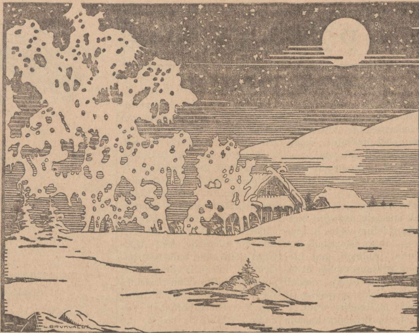
Nepriklausoma Lietuva Vasario 16-tos naktį

VLIKas naudoja žinių perdavimui į pavergtą tėvynę lietuviškai Romos, Madrido ir Vatikano radijo fonais. Okupantas labai bijo tiesos žodžio iš laisvojo pasaulio ir įvairiais būdais prieš siuntimą kovoja.