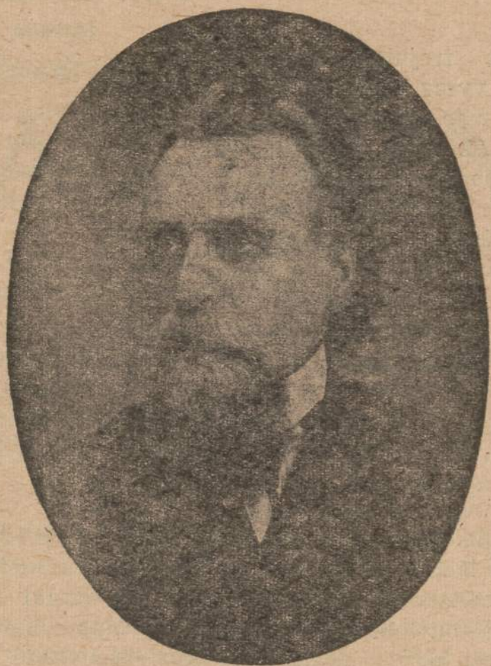
Dr. Jonas Basanavičius