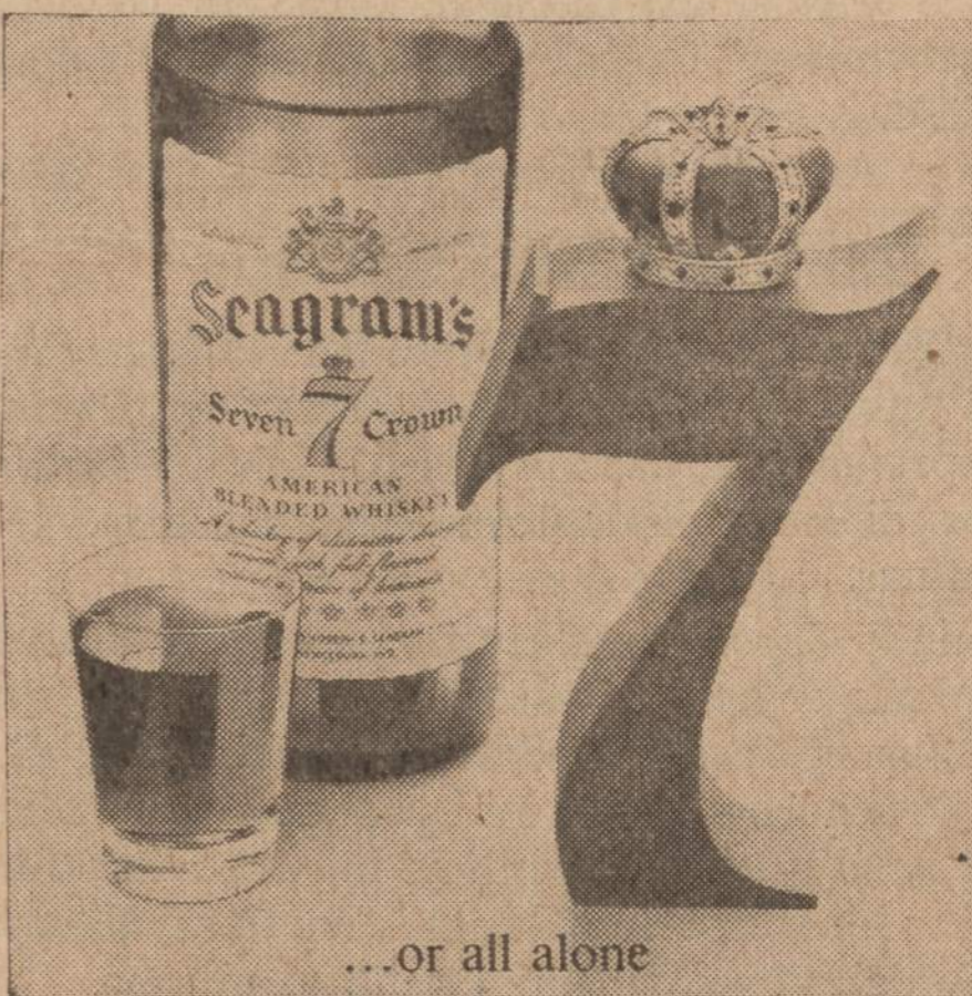
...or all alone

Tik su Seagram's 7 Crown galima padaryti tiek daug įvairių, visiems patinkančių, švelnių ir tikrai gerų gėrimų. Koks bebūtų jūsų mėgiamausias gėrimas,