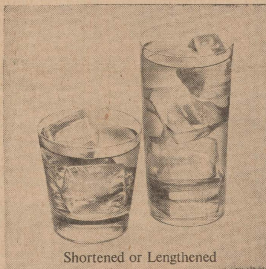
Shortened or Lengthened