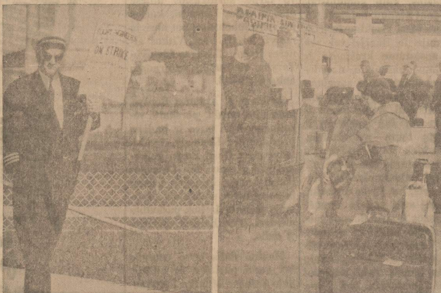
Lėktuvų inžinieriai atsisako atšaukti streiką. Tai padaryti juos prašė darbo sekretorius Goldberg. Susisiekimas lėktuvais labai sumažėjo ir daug darbininkų, dirbančių prie lėktuvų aprūpinimo, jau atleista ir vis daugiau atleidžiama.

Kai Washingtono korespondentas Jack Anderson vargais negalais pasiekė Cukuro rezidenciją ir jį patį, Cukurs pareiškė (Tęsinys 5 pusl.)