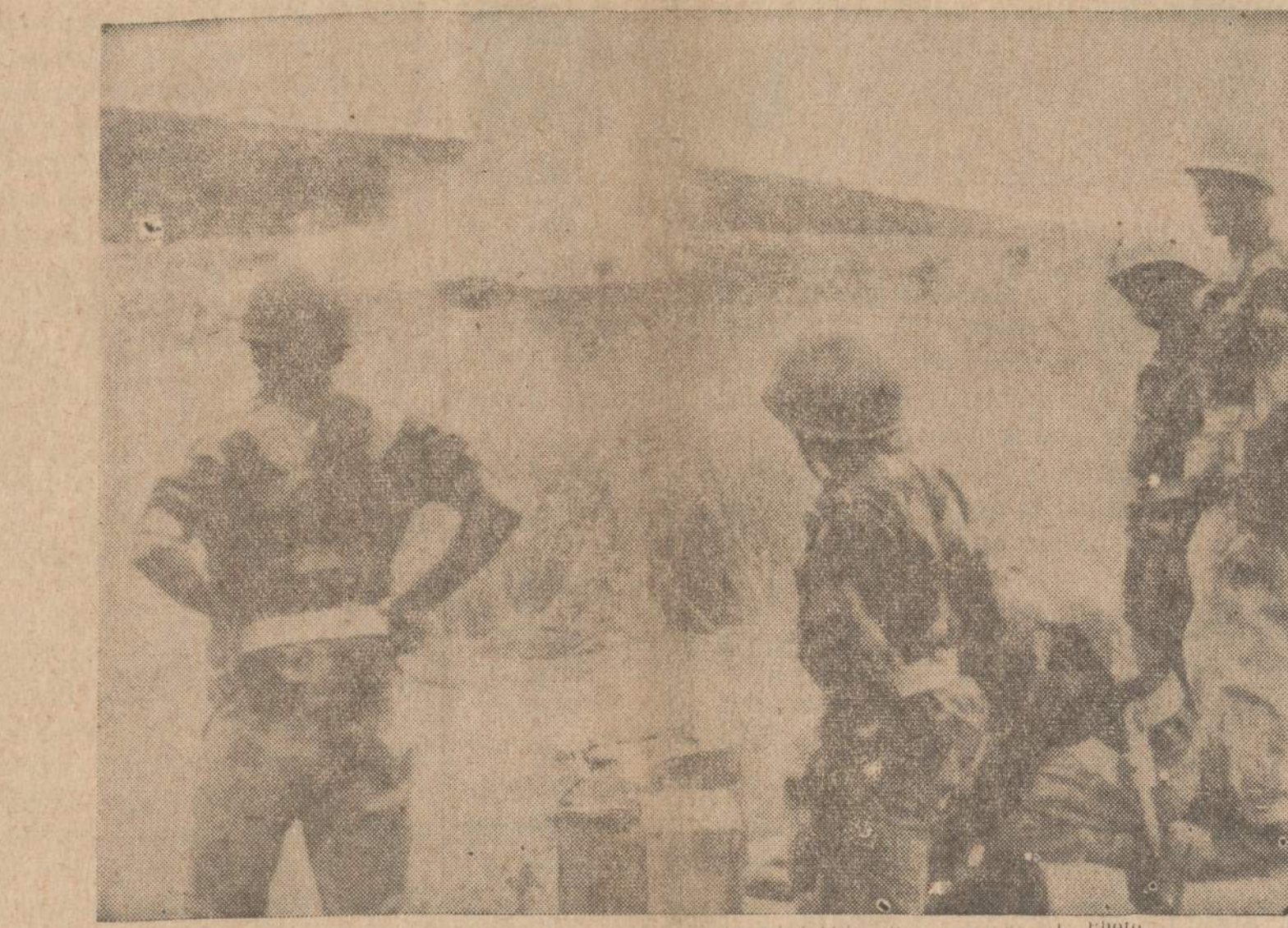
Katangos kariuomenė Kongo Luenos srityje pradėjo karinę operaciją, bandydama iš ten išvyti sukilėlius ir užimti geležinkelio liniją, kurią kontroliuoja Lumumbos šalininkai.

Vaikant burmiečių minią nuo JAV ambasados, kariuomenė naudojo ginklus. Penkis demonstrantus sunkiai sužeidė.