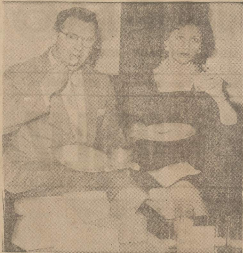
Sen. Vance Hartke ir jo žmona ragauja maistą, kuris buvo patiekiamas laikraščiu korespondentams. Senatoriui pareiškė, kad tai esąs "tragiškas amerikoniškas valgis". Tas maistas yra dalinamas žmonėms, kuriuos skaudžiausiai palietė nedarbas. Jis susideda iš ryžių, kukurūzų miltų, sumaišytų su riebalais, ir pieno miltelių.

Siunčiame $25 auką Vasario 16-tos, Lietuvos nepriklausomybės 43 metų sukaktuvėms. Labai atsiprašome, kad neišgalėjo-