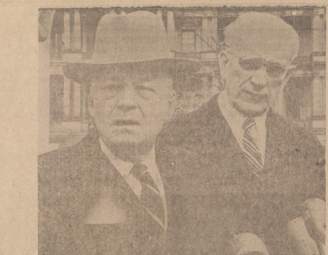
Po konferencijos su prezidentu Kennedy kongreso pirmininkas Sam Rayburn pareiškė, jog Amerikos ekonominė padėtis yra labai rimta. Rayburn (kairėje) ir John W. McCormack, kongreso daugumos vadas, kalbasi su spaudos atstovais.