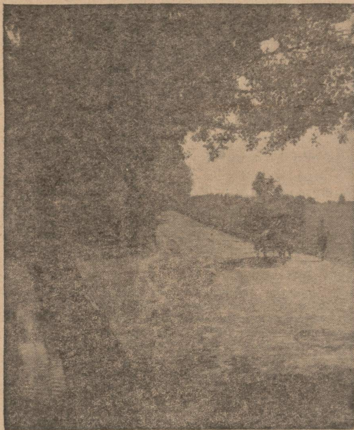
Kelias vieškelėlis, mus veda į namus...