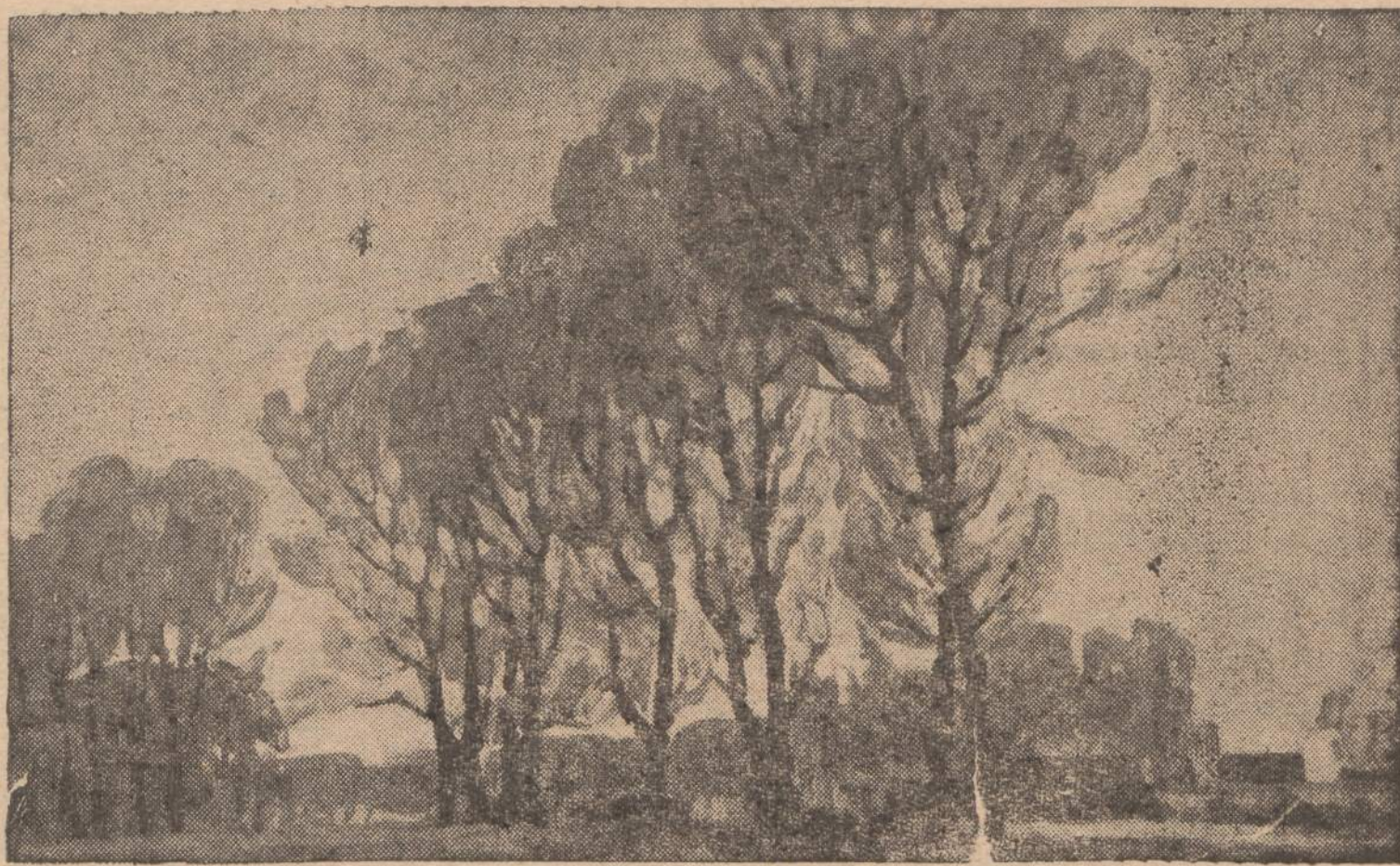
Žiemos peizažas Lietuvoje

7 — NAUJIENOS, CHICAGO 8, ILL. — SATURDAY, FEBRUARY 25, 1961