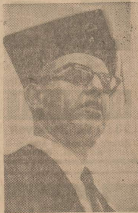
Darbo sekretorius Arthur Goldberg sako kalbą Amerikos žydų teologinėje seminarijoje, esančioje Miami, Fla. Tos seminarijos vadovybė jam įteikė Herbert H. Lehman medalį.