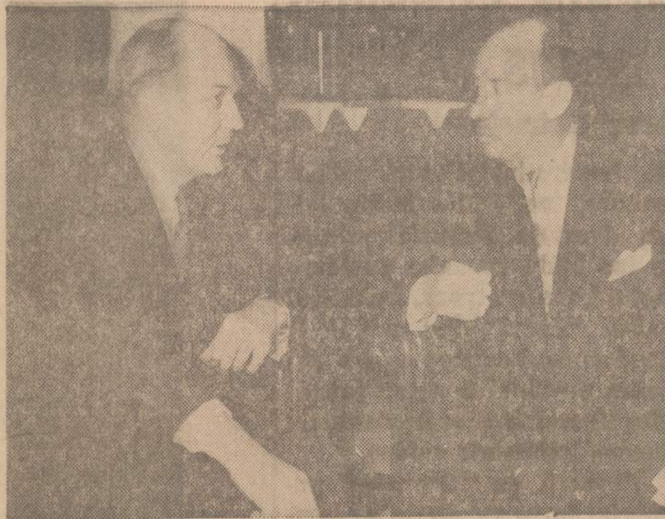
JAV ambasadorius Jungtiniams Tautoms Arthūras Stevensonas pasakė, kad Sovietų Rusijai siekia suardyti Jungtines Tautas, nes jos trokdo sovietams išgelbėti Afriką. Stevensonas tai pasakė pasikalbėjęs su Valst. sekretoriumi Dean Rusk.