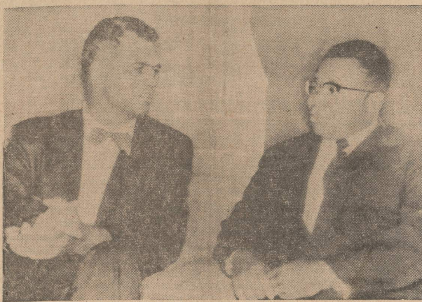
G. Mennen (Soapy) Williams (kairėje), kuris yra Amerikos valstybės sekretoriaus padėjėjas Afrikos reikalams, kalbasi su Kongo respublikos prezidentu Joseph Kasavubu. Juodu susitiko Leopoldville mieste, kuris yra Kongo sostinė.

BONA. — Vakarų Vokietija sutiko padidinti savo dalį padedgti Nato gynybos organizacijos išlaidas. Ligi šiol ji padengdavo 13% išlaidų, ateity padengs 20%. Amerikos išlaidų našta nuo 36% nukris iki 31% (mokės $12 mil. mažiau).