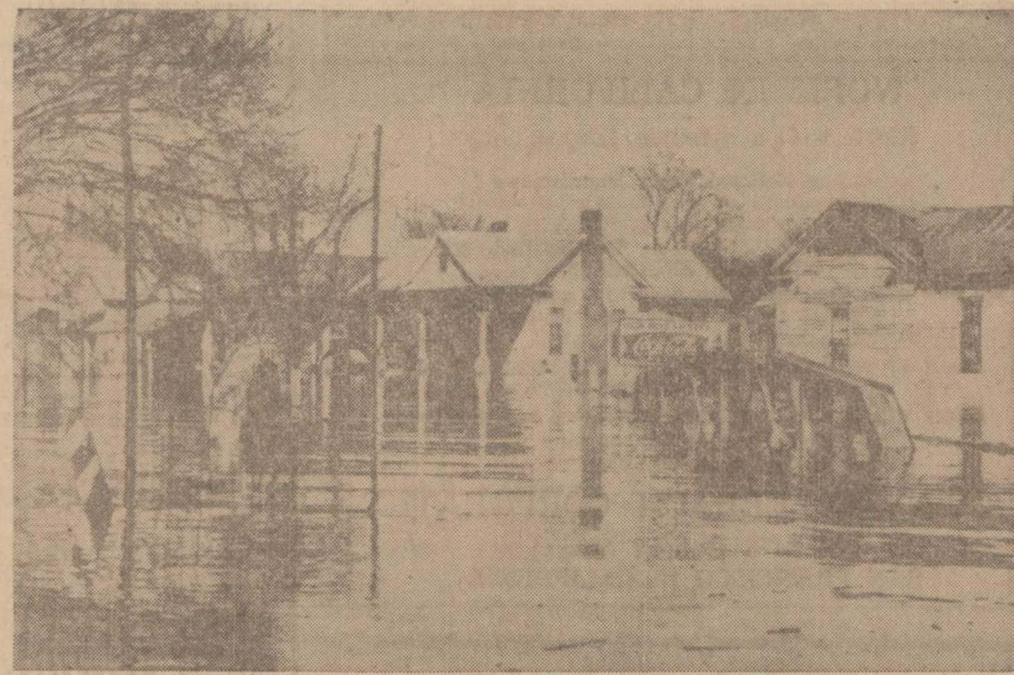
VAIZDE MATOMI DU PILNO RĖMAI (kairėje ir dešinėje) yra tilto turėklai skersai Holland Creek prie Phoenix City, Alabamoje, kur nepaprasti potvyniai pridarė gyventojams milijonus nuostolių. Normaliu laiku tas tiltas yra 12 pėdų viršum vandens.