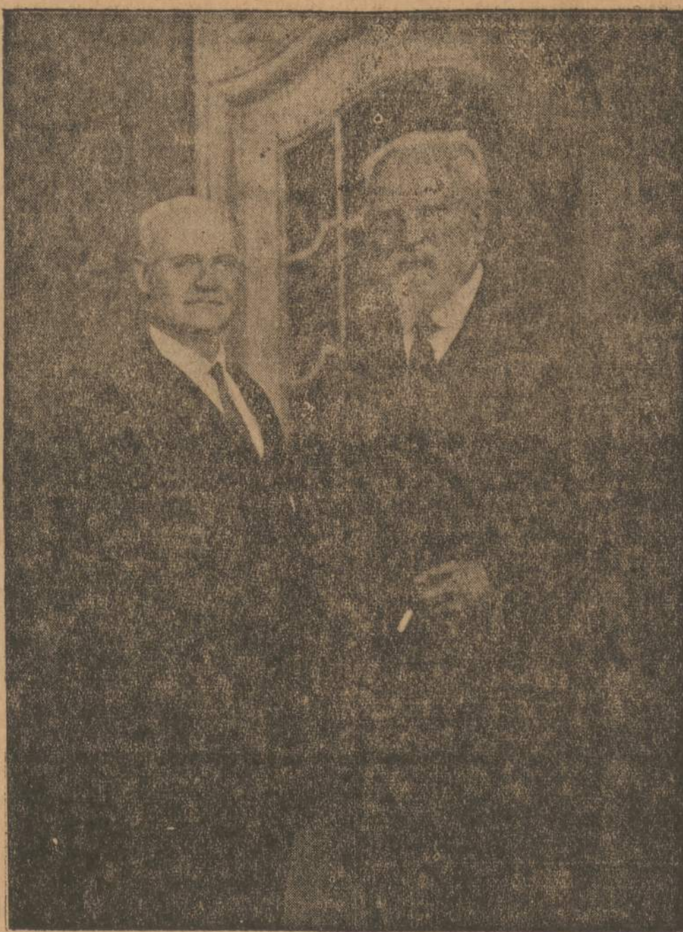
Ši nuotrauka buvo nuimta 1936 m., kai dr. Jonas Šliūpas atvyko į Chicago ir dalyvavo Lietuvių Tautinių Kapinių 25 metų sukakties minėjime. Nuotraukoje Dr. P. Grigaitis ir dr. Jonas Šliūpas (dešinėje).

Noriu šia proga dar išskirti kai kuriuos Dr. Šliūpo veiklos momentus ir jo pažiūras. Dr. J. Šliūpas karštai troško, kad Lietuva nebūtų priskiriama prie atsilikusių Europos kraštų, bet kad ji būtų vienoje eilėje su pažangiosiomis Europos šalimis. O pažangiam, kultūringame krašte nebegali būti žmogaus