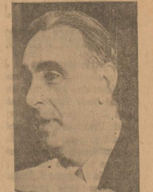
Sveikatos, švietimo ir gerovės sekretorius Abraham Ribicoff senato pakomiteo posėdyje pareiškė, jog kongresas turi tuoj priimti prezidento Kennedy pasiūlymą paskirti $5,600,000 švietimo ir mokyklų reikalams.