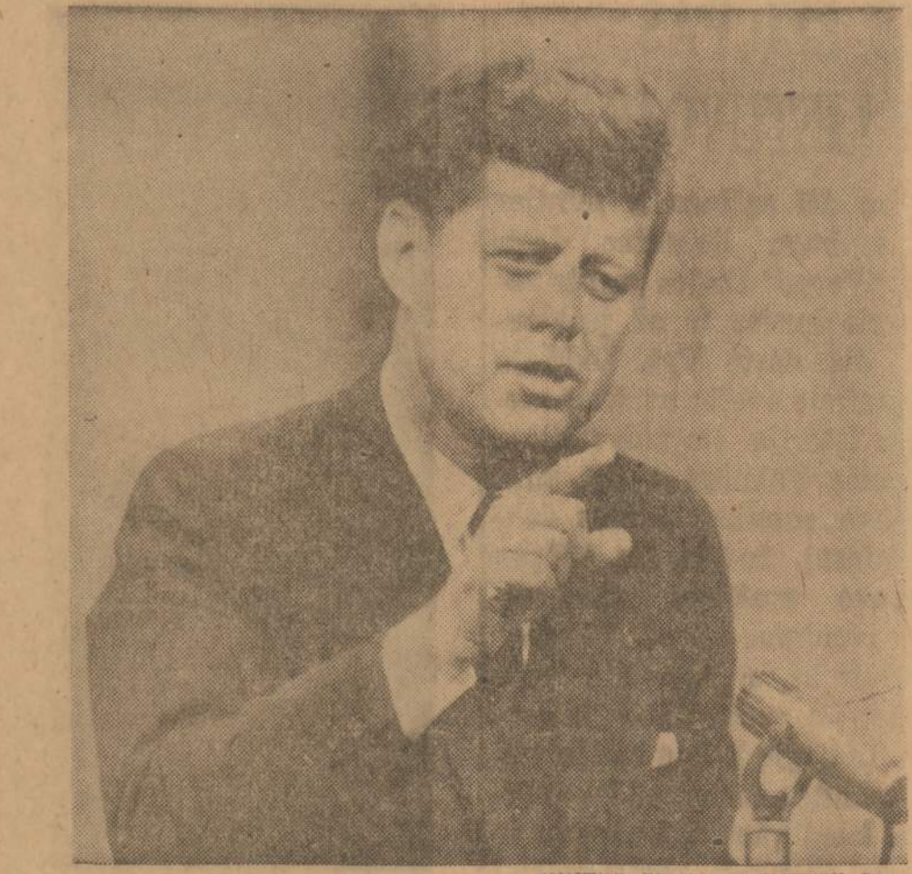
Prezidentas John F. Kennedy spaudos konferencijoje ragino kongresą priimti jo siūlomą pagalbą mokykloms. Jis pareiškė susirūpinimą, kad jo pasiūlymas gali užklūti, jei neatsižvelgs į ginčai dėl segregacijos ir rėmimo parapijų mokyklų.

kuris stengėsi paruošti dirvą lietuvių tautos kultūrinei pažangai, pašalinus iš jos kelio kliūtis, kurios ją trukdė. Už tai lietuvių tauta visada bus jam dėkinga.