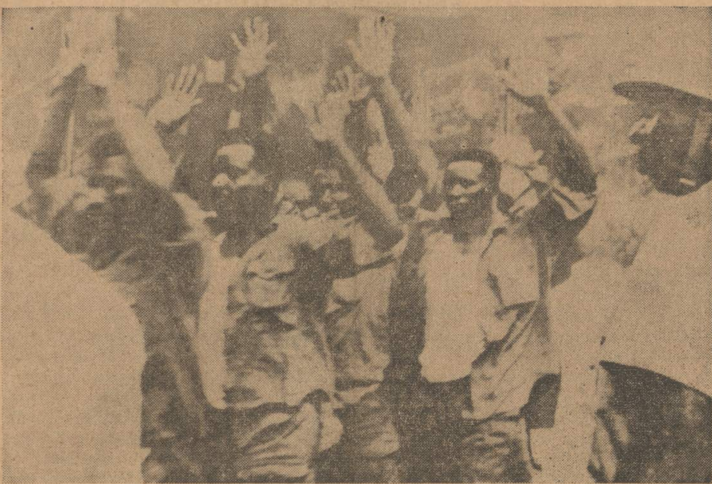
Jungtinių Tautų sudaniečių dalinio kareiviai kongiečių nelaisvėje Matadi uoste, Kongo.

Buvo laikomasi arba atskirų susitarimų, arba senų diplomatinių įpročių. Konferencijoje dalyvauja ir sovietinio bloko delegatai. Jie, be abejo, stengsis į diskusijas įnešti projektus, kuriais būtų sudaromi sunkumai egzistuojančioms atstovybėms. Iš šio požiūrio konferencija gali būti įdomi ir Pabaltijo sluoksniams.