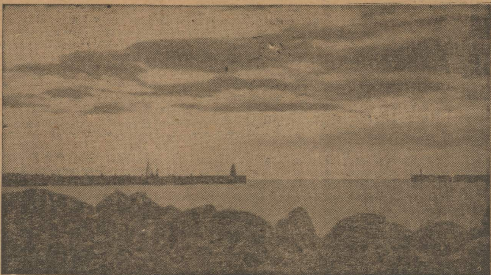
NEMUNO ANGA, PPLAUKIMAS I KLAIPĖDOS UOSTA, LIETUVOS VARTAI I PASAULI Vaizde matomi abudu Klaipėdos uosto molai — pietinis (kairėje) Kopgalio molas su švyturiu ir šiaurinis (dešinėje) Melneragės molas su kitu švyturiu. Per šią angą išeina Nemunas į Baltiją ir per ją laisvos nepriklausomos Lietuvos laikais buvo prasidėjęs Lietuvos gyvas jūromis susisiektimas su Vakarais ir visu plačiuoju pasauliu.

Ko jaunimui svarbiausiai reikia, tai užsiėmimo. Ragen patiekė pavyzdį. Statenville kalėjime yra jaunas vyrukas, kurs, būdamas 18 metų, apiplėšė ir nužudė žmogų ir gavo 199 metus kalėjimo. Prieš porą metų tas jaunas nusikaltėlis paprašė kalėjimo administraciją dažų ir teptukų. Sakė-