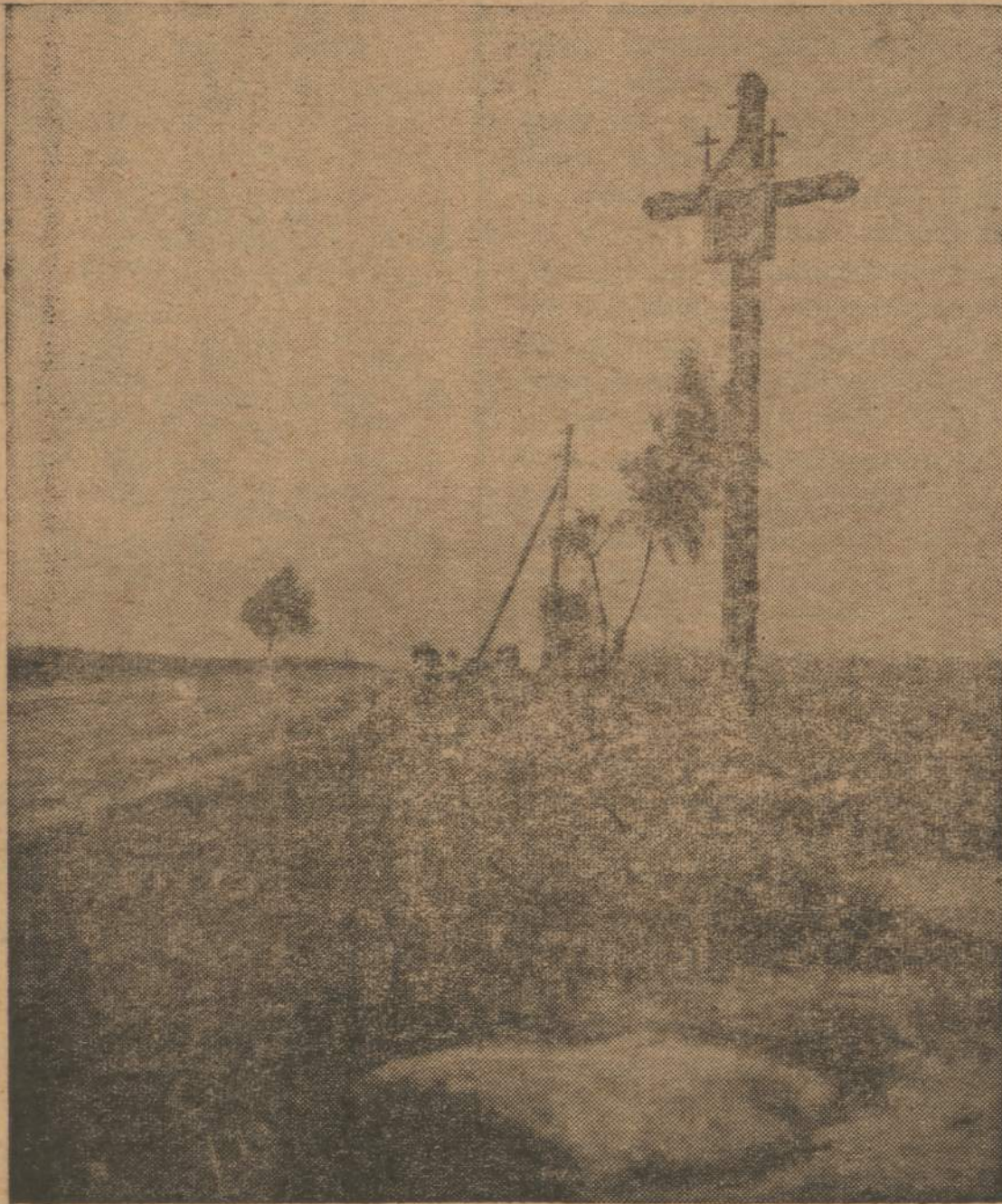
"Kur pradingo tas kelelis, kur pro kryžių ėjo?"