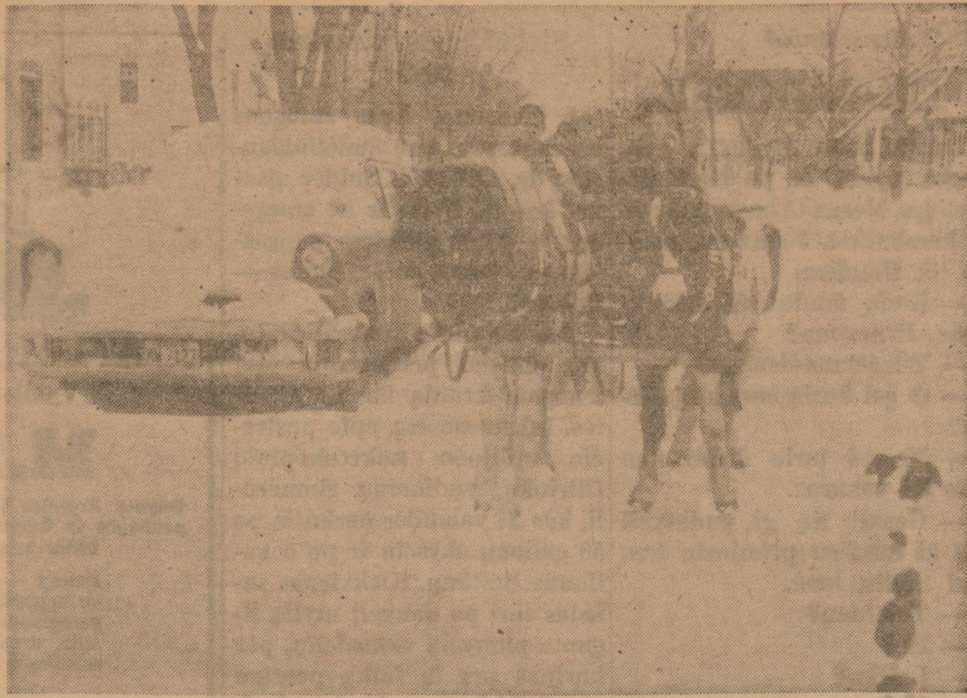
Ulm, Minn. — Taip berniukai leido laiką, kai nustojo snigti (prisnigo 14 colių gilumo sniego).

4 — NAUJIENOS, CHICAGO 8, ILL. — SATURDAY, MARCH 11, 1961