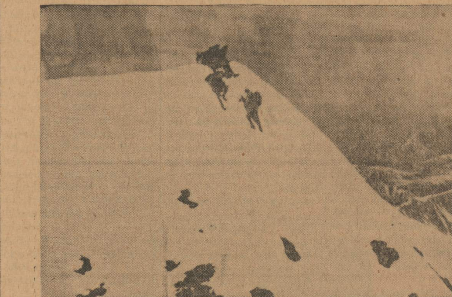
Keturi alpinistai, nugalėję pavojaingą 6,000 pėdų aukštumo Elgerio šiaurinę sieną Alpių kalnuose netoli Kleine Scheidegg, Šveicarijoje. Tai yra pirmas užlipimas žiemos metu. Lipimas truko visa savaitė. Nugalėtojai sako, kad jiems pavyko tik dėl dviejų sąlygų: viena, kad pasitaikė "geras oras", kita kad jie turėjo laimės.

Grįžkime prie reikalo: mano pokalbininkas, pasirodo, ne tik įdomavosi, bet ir pats, kartu su kitais talkininkais: "...dažnai į tešlą (cemento) įmaknodami, karukais vežėme cementą, kur mašina išpilti nepasiekė". o kitar "...vakarajimui ugniakūriui kelmus kyliais ir kūjais plaišino". Vadinasi, ir anksčiau žinojo, jog mašinos ne visus darbus atlieka. Tai kuriems galams reikėjo dievažintis, jog: "Pagaliau ir akmens skaldomi nebe kūjais daužant, cementas maišomas nebe kriukių. Medžius darbininkai verčia, sušalusią žemę kasa mašinas valdydami". O kas, gal malonėsite pasakyti, išverstus medžius, kad ir elek-