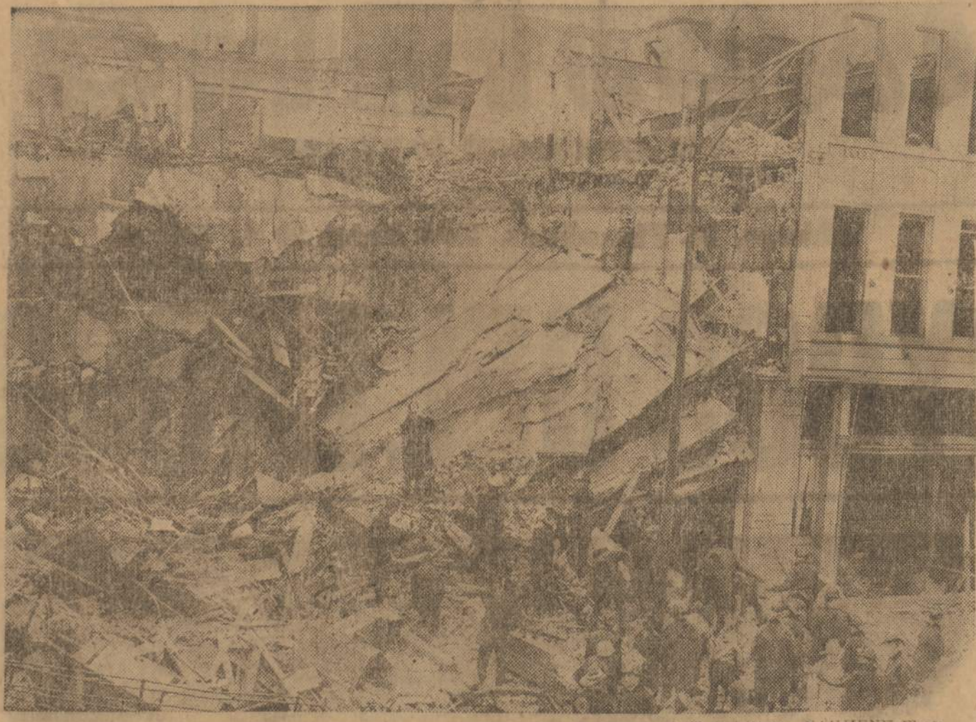
Trijų aukštų namas Chicagoje, kurs praėjusia savaitė, ketvirtadienį, darbininkams jį bagriaunant nuo viršaus, staiga visas sugriuvo. Iš trijų užgriautų darbininkų du mirė nespejus juos išgelbėti. Keliolika kitų darbininkų sužeista.