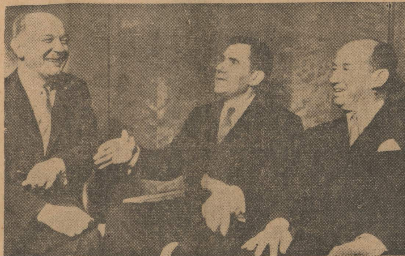
Valstybės sekretorius Dean Rusk (kairėje), Sovietų užsienio reikalų ministras Gromyko (viduryje) ir ambasadorius Jungtinių Tautoms Adlai Stevenson susitiko Washingtone ir aptarė tarptautinio pobūdžio klausimus.

Italijos rinkoje gazolinas parduvinėjamas automobilstams 5% pigiau už Sovietų įvežimą gazoliną. Iranas ir arabų šalys dabar spausti, kad ir JAV firmos paliktų daugiau negu 50% pelno šaltinių savininkams.