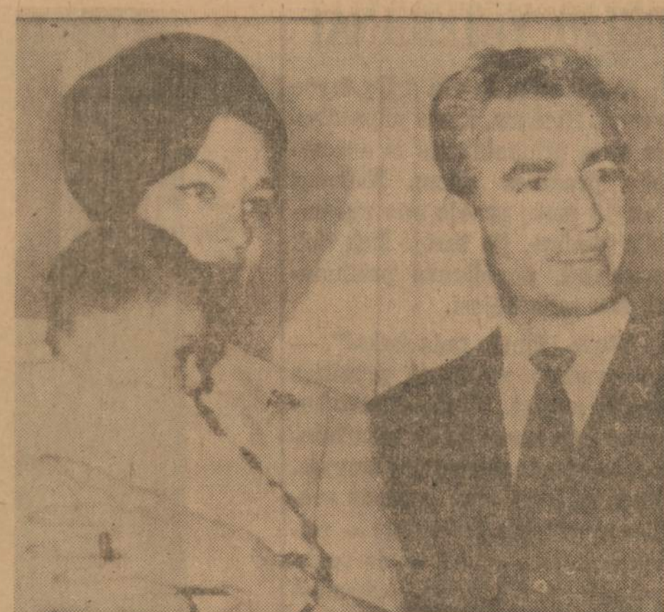
Irano žačas stovi šalia savo žmonos, karalienės Farah, kuri laiko savo keturių mėnesių sūnų, princa Reza Cyrus Ali. Prieš kurį laiką Iraną valdovus aplankė Anglijos karalienė Elzbieta.

tinė Kennedy administracija. Pagarba Amerikos doleriui — Amerikos demokratijos principams! — verčia draugą Gomulką šiek tiek susivaldyti.