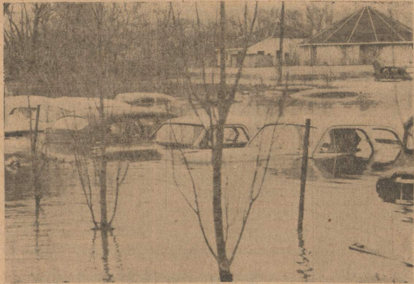
Root upė patvino prie Rushford (Minn.) miestelio. Vanduo ne tik užliejo to miestelio namų rūsis, bet vietomis pakilo iki langų. Plentas No. 16 vietomis yra vandens apsemtas ir juo neįmanoma važiuoti.