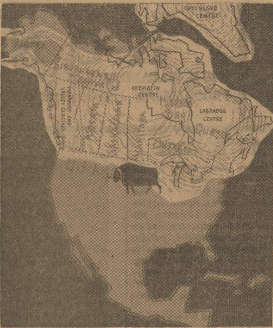
Kanada ir Didieji Ežerai paskutinėje ledų gadynėje

Manitoba skersai turi 309 mylias, trečdalis yra į rytus nuo Winnipeg'o, taigi ir vakarus bus apie 200 mylių. Alberta skersai turi 333 mylias, o tuojuo už Lake Louise persivertus per Great Divide (Didįjį Pieskviimą), iš kurio vienos upės teka į rytus, kitos į vakarus, prasideda 680 mylių Britų Kolumbija, per kurią važiujant, kaip žinantieji sako, iki pasieki Vancouverio miestą Pacifiko pakraščiuje, visą laiką važiujant kvapą užėmęs, nes vaizdai ir gamtos didybė bei grožybė visą laiką neduoda atsipeikėti.