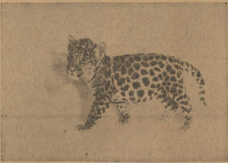
Šis jaguariukas yra Tupi ir Yaqui (jaguarų poros) vaikas, gimes Linkolno parke praėjusio sausio 14 d. Gimes jis svėrė tik 1 svarą ir pusketvirtus uncijos. Laisvai gimę jaguarai vaikai laikosi su tėvais devjus metus, bet Linkolno parke jis buvo atimtas ir padėtas į inkubatorių ir girdomas pienu iš bankos.

JAGUARIUKAS — BALANDŽIO MĖNESIO GYVULIUKAS