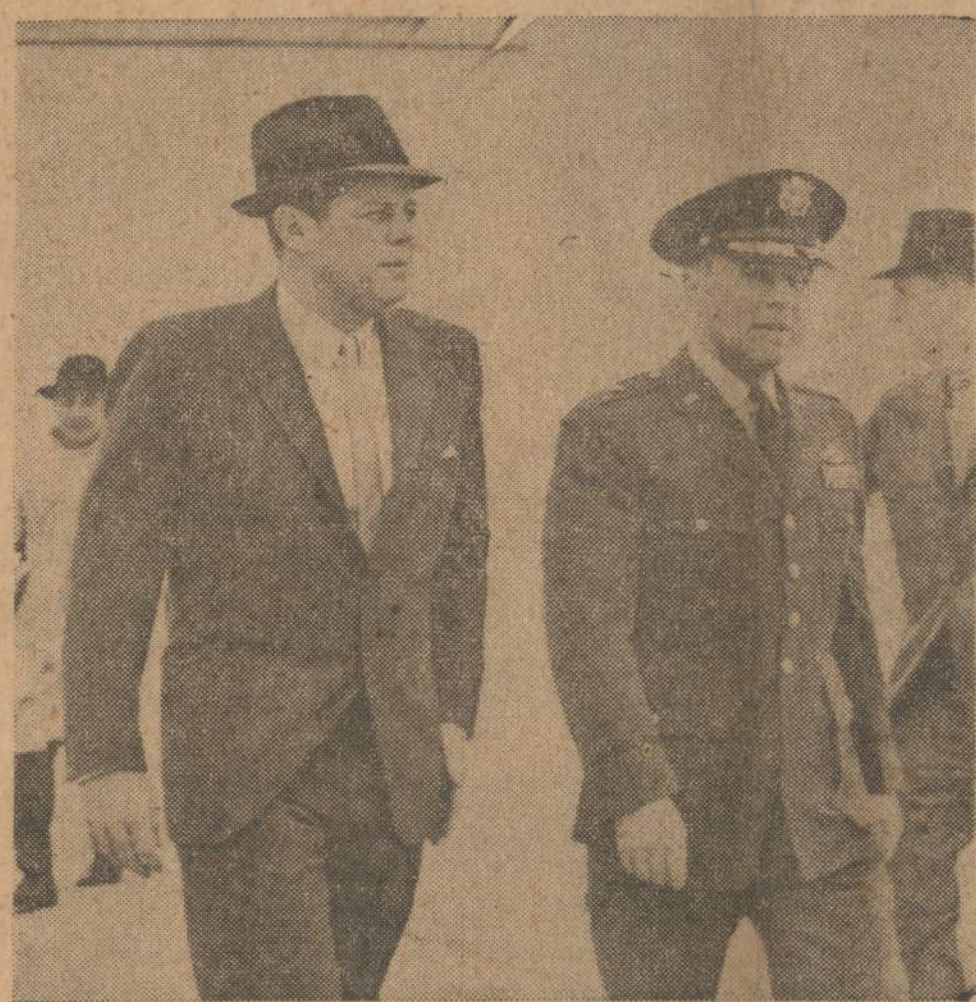
Prezidentas Kennedy eina į lėktuvą skristi į Palm Beach, Fla., pas šeima, su kuria praleis Velykų šventes.