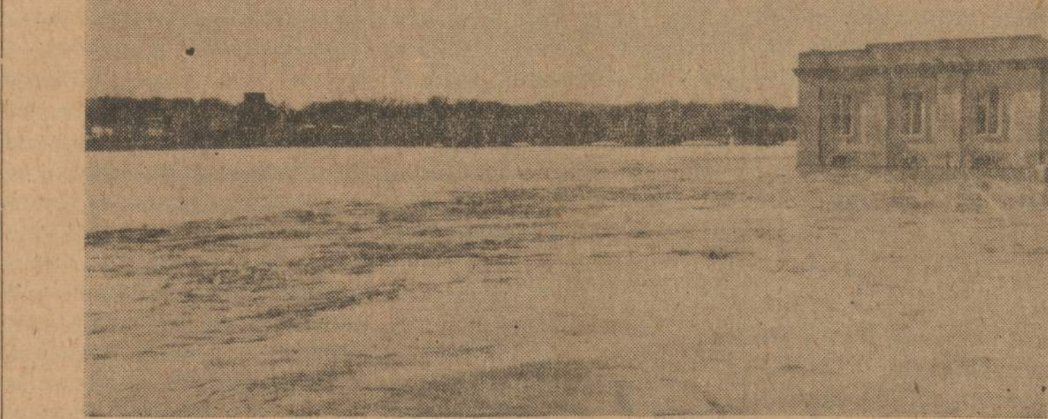
Cedar Rapids (Iowa) elektros jėgainė trumpam laikui buvo uždaryta, kai ėmė smarkiai kilti upės vanduo. Jėgainė vėl pradėjo veikti, kai vanduo atsūgo.

K. Plioplys savo atsiminimuose gražiai nušneka, kad, žygiuojant gilyn į Lietuvą, Vilniaus šaulių pulko daliniai visur valdžiečių buvo sutikti džiaugsmingai šaukiant raudonajai armijai valio. Esą raudonoji armija visur elgėsi su žmonėmis gerai, jei ką paįmavo, tai ir atlygindavo — už visa mokėjo, nes pinigų turėjo daug... tik pritrū-