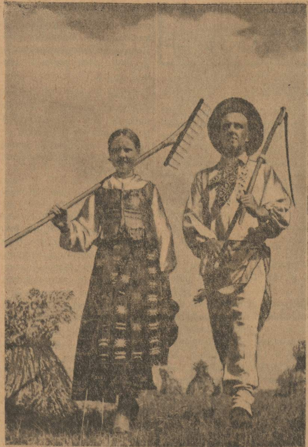
Kai aš grebiau lankoj šiena, šienelį, šienelį...

Užtinkame 1946 m. birželio mėn. 9 d. datą. Ji Dainavai reikšminga ir džiugi: tą dieną įvyko ansamblio krikštynos. Pienoje žmonėmis Hanau stovyklos salėje skaitomas krikštytynų aktas: