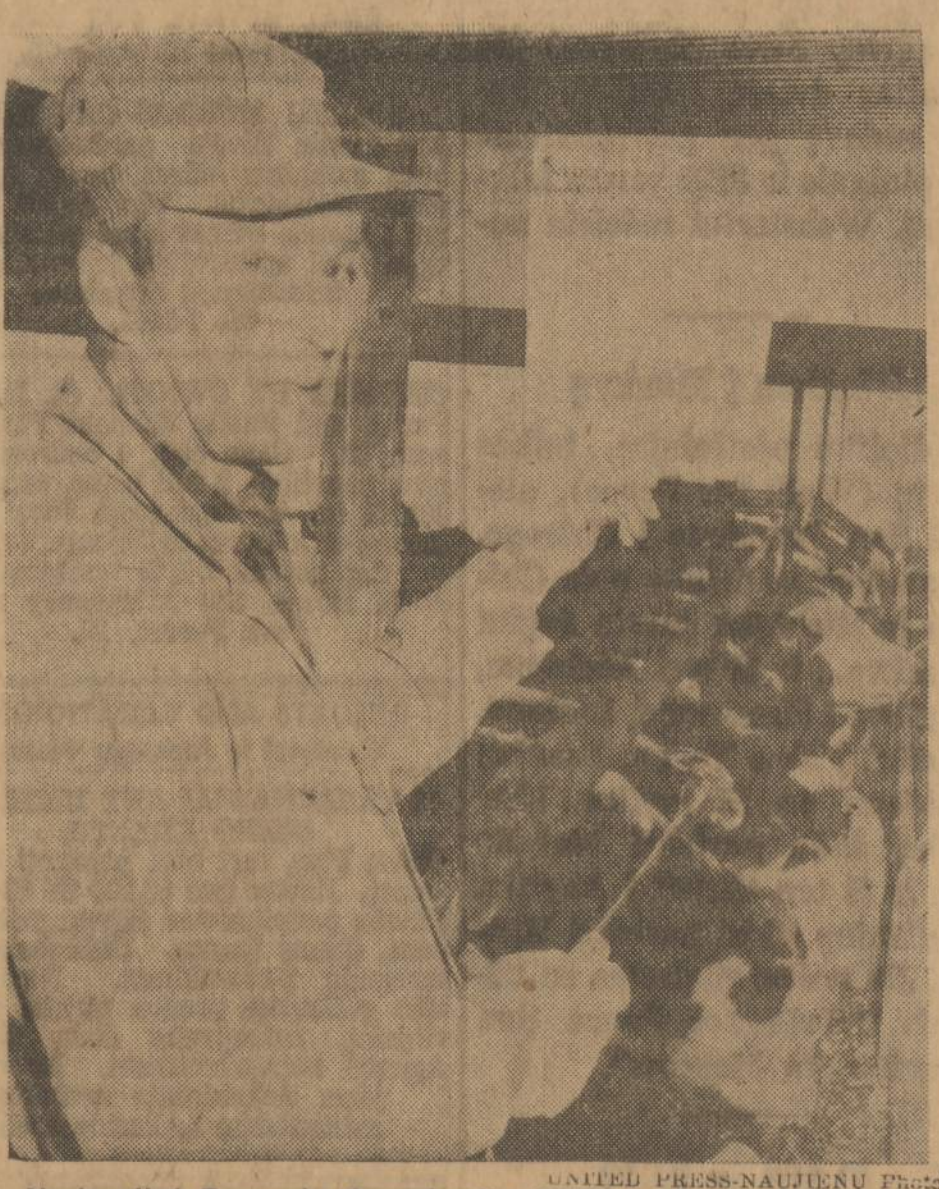
Nacionalinė Farmerių Organizacija (NFO) ruošiasi sulaukyti siuntimą į rinką gyvulių, raguočių, kiaulių ir avių tel, kol nebus patenkintas jų reikalavimas padidinti gyvulių produktams kainas. Čia matomas plakatas vieno Wisconsin farmerio ūkyje.