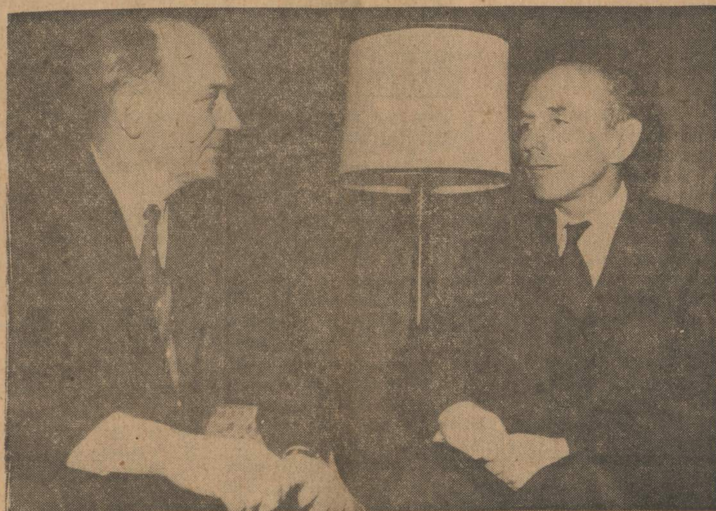
Britų užsienio reikalų ministeris lordas Home (dešinėje) ir JAV valstybės sekretorius Dean Rusk susitinka valstybės departamente Washingtono, kur Home atvyko kartu su britų premjeru tartis su prezidentu Kennedy.

tų sprendimą, pagal kurį šiam atomikos mokslininkui (jis buvo pirmos atominės bombos gamintojo direktorius) buvo uždrausta prieiti prie Amerikos atominio paslapčių, kaip komunistų draugu.