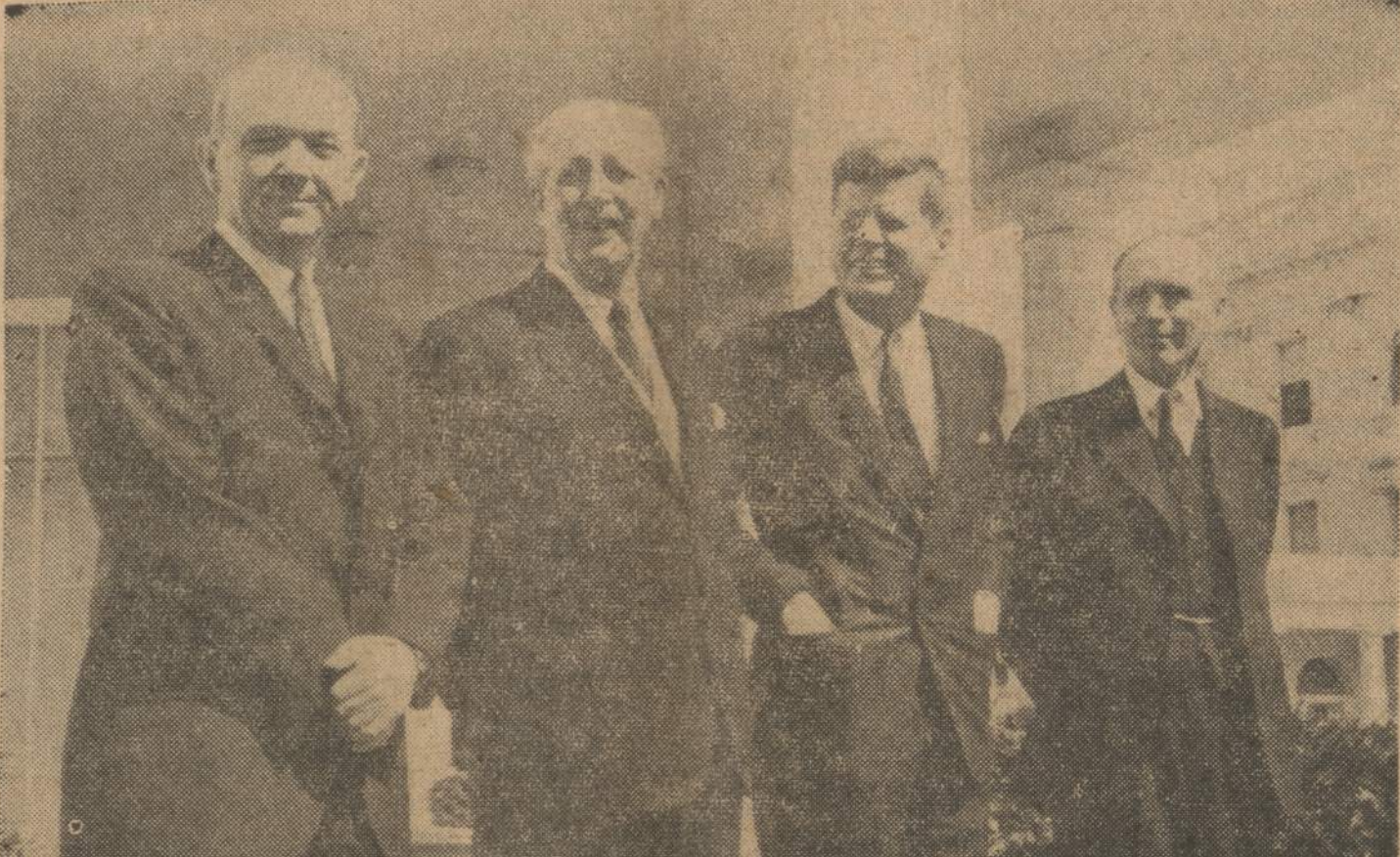
Prezidentas Kennedy, Anglijos premjeras Macmillan ir jų padėjėjai fotografuojasi. Tuoj po to Prezidento ofise prasidėjo konferencija, kurioje buvo aptarta Laos krizė. Iš kairės į dešinę: valstybės sekretorius Dean Rusk, Macmillan, Kennedy ir Anglijos užsienio reikalų ministras Home.