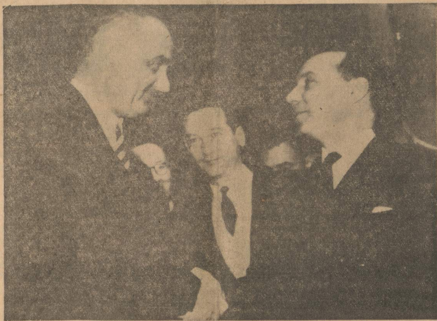
Viceprezidentas Lyndon B. Johnson (kairėje) išeina po aplankymo prezidento Kennedžio premjero Michel Debre, su kuriuo jis tarėsi apie 45 minutes. Pasitarimas daugiausia lietė numatomą konferenciją tarp De Gaulle ir prezidento Kennedžio, kuris netrukus rengiasi keliauti į Prancūziją.

McNamara kiek anksčiau paliepė aviacijos, laivyno ir armijos sekretoriams peržiūrėti savo ginklų arsenalus ir išstudijuoti, kokių naujų ginklų daugiausia reikalinga.