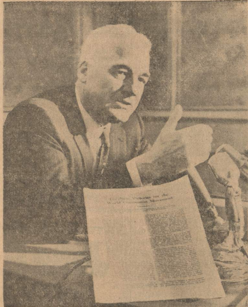
Generolis Nathan Twining, buvęs JAV vyriausiojo štabo viršininku pirminkas, kalbėjo Chicagoje. Jo kalbos tema buvo "Saugumas šių dienų pasaulyje". Kalbėdamas gen. Twining prisiminė apie knygutę (ji guli priešais jį), kur esan išdėstyti Nikitos Chruščiovo planas, panašus į Hitlerio "Mein Kampf".