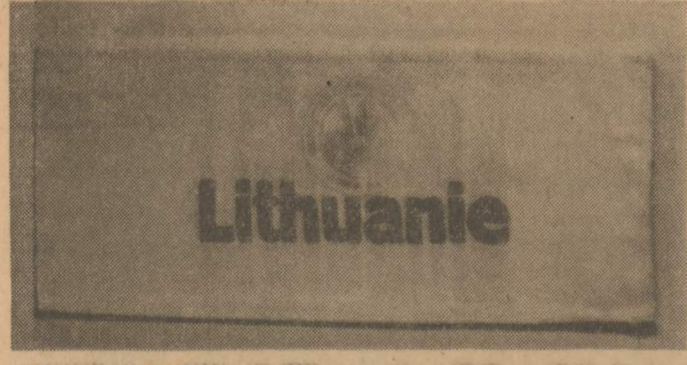
(Krislielis istorijėlės iš DP gyvenimo II Pasaulinio karo nugalėtoje Vokietijoje, prancūzų okupacijoje zonoje)

NAUJIENU OFISAS atdaras kasdien, išskyrus sekmdienius, nuo 9 ryto iki 5 val. vakaro, šeštadieniais — iki 12-tos.