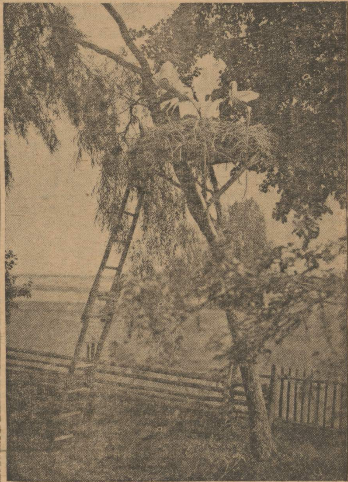
Pavasaris Lietuvoje — Vilniaus krašto vaizdelis. Gandras parskrido.