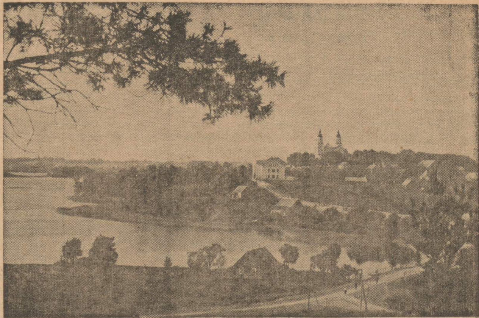
ZARASŲ Miesto DALIS EŽERO PAKRANTĖJE

Na, o dabar pavergtoje Lietuvoje ir kitų pavergtų tautų tarpe “vyresnysis brolis” ar kitaip elgiasi? Tiesa, dabar viešai lyg ir draudžiama kitas Sovietinės Rusijos vergiamas tautas pasityčiojimui vadinti “inorodcais”, “čionykščiais”. Visoms joms Maskvoj nukaltas pavadinimas “sovietinė liaudis”. Tiesa, dabar viešai nesakoma, kad tie “čionykščiai” iš prigimties yra atsilikėliai, bet savo darbais “vyresnysis brolis” elgiasi kaip su atsilikėliais. Visur ir visomis progomis atsakingoms pareigoms, pelnin-gesnėms tarnyboms toms sovietų pavergtomis tautoms, kartu ir Lietuvai, primetami “specialistai” iš Maskvos ir net neleidžiama švietimo bei kultūros reikalus tvarkyti nepriklausomai nuo Maskvos diktato. Čia ir glūdi “vyresniojo brolio” pažiūra į “čionykščius”, kaip “iš prigimties nesugebančius” tvarkyti savo šalyje nepriklausomai nuo Maskvos visą