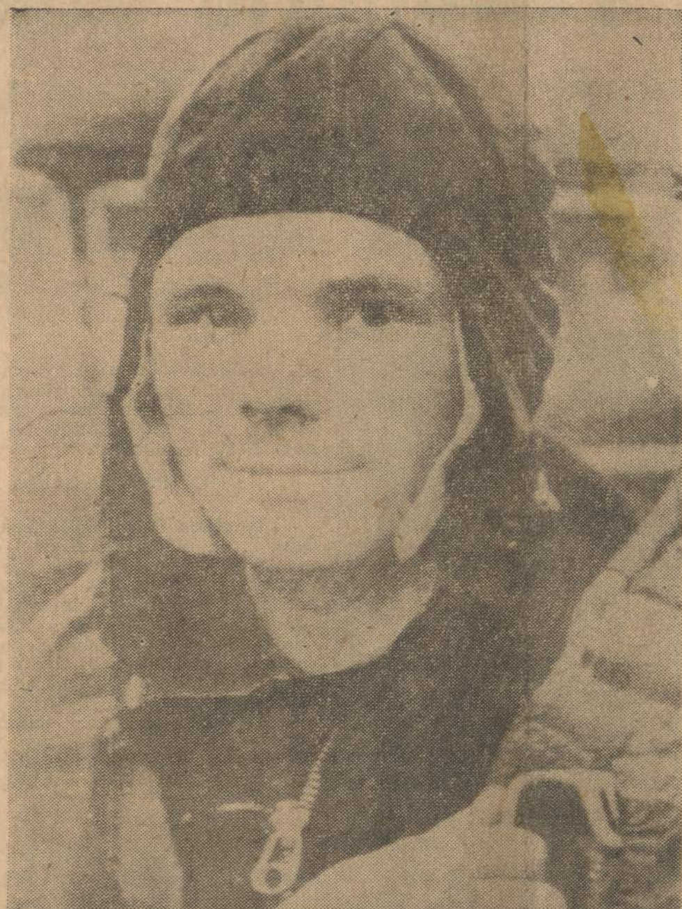
Sovietų astronautas Juri Gagarin, kuris pirmas paleistu į erdvę satelitu apsklavo aplink žemę ir laimingai vėl nusileido visaiškai sveikas.

Už panašų galvojimą Salazaras pašalino armijos ir užjūrio teritorijų (kolonijų) ministrus, kariuomenės štabo viršininką ir Lisabonos apygardos karinį gubernatorių.