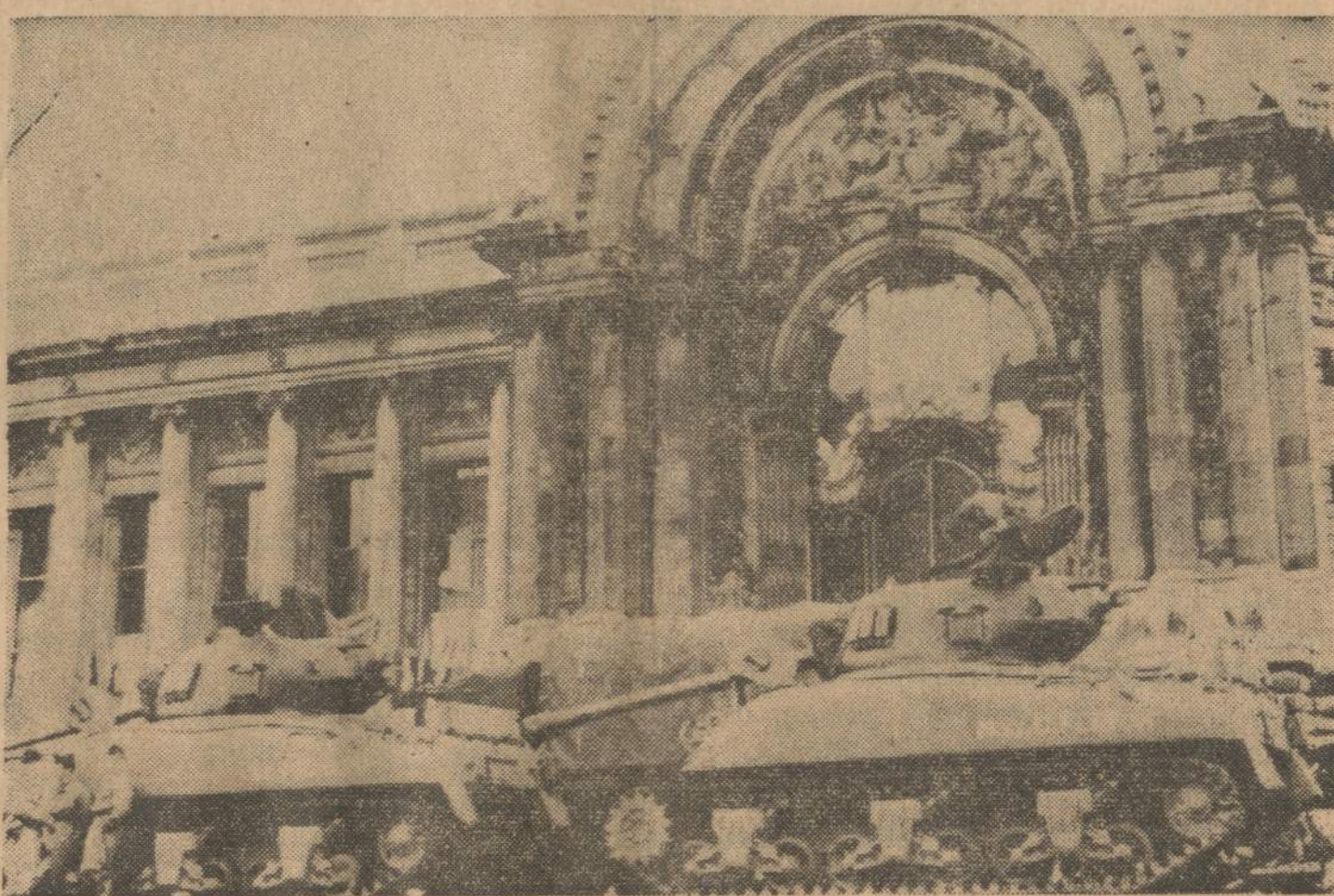
Prancūzų tankai prie Grand rūmų Paryžiuje. Jie telkiami tam, kad galėtų sulaukyti Alžiro sukilėlių ataka, jei tie bandytų parašutais nusileisti prie Paryžiaus.

Atlas raketa, kiek paskridus, susprogo. Astronauto marionetė buvo laiku išsviesta iš kapsulės ir nusileido į Atlantą, iš kur ją ištraukė laivyno narai.