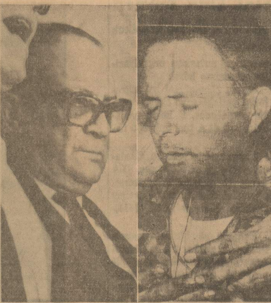
Jose Miro Cardona, sukilėlių vado sūnus, paleis su kitais kubiečiais į Castro nelaisvę, nufotografuotas Havanoje, Kuboje. Jis buvo išsikėles Kuboje su kitais kubiečiais sukilėliais kaip radio mechanikas.

Prezidento laikysena liūdi ją esant didelio masto valstybininku.