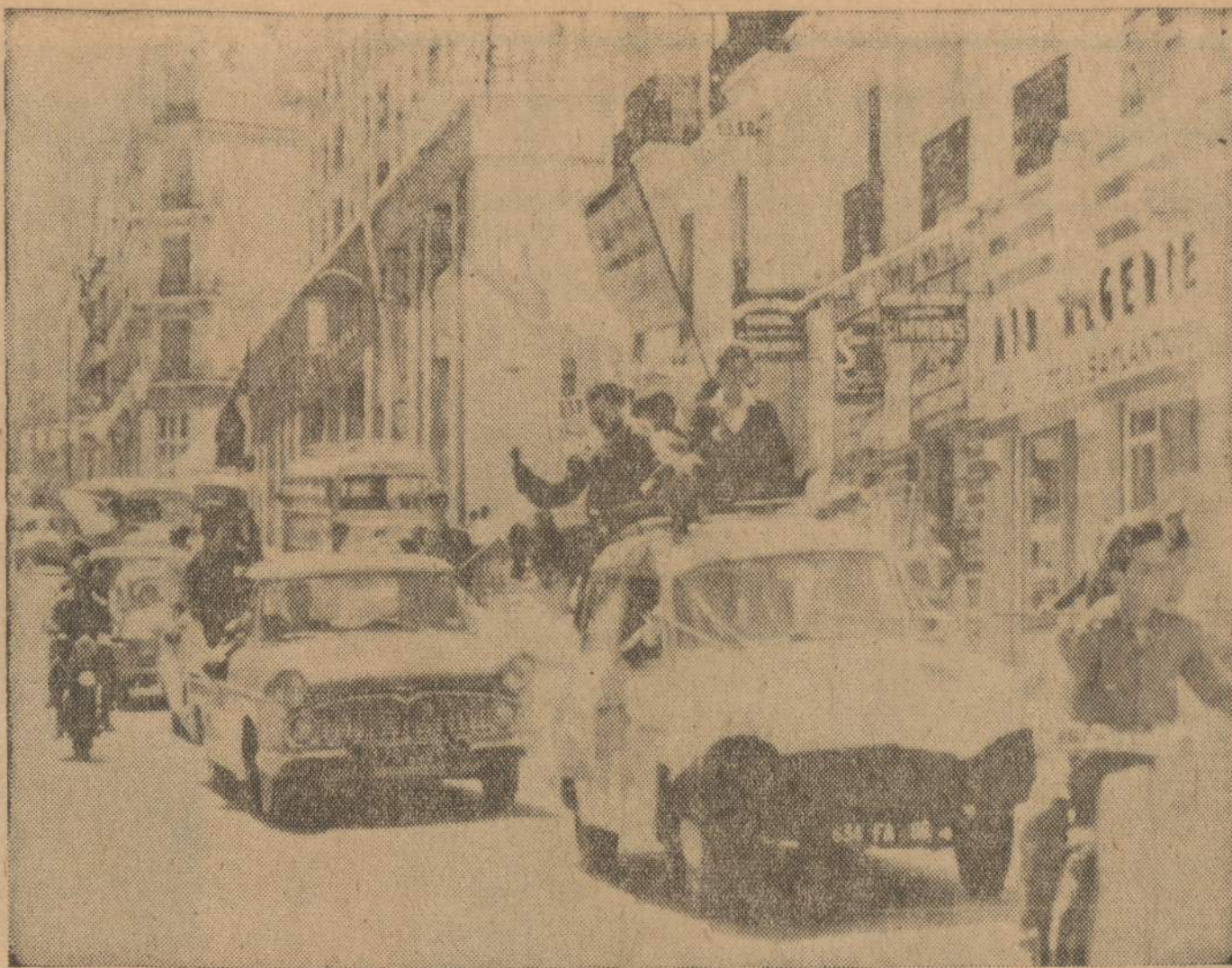
Sukilimą paskelbusių generolų šalininkai užėmė Alžire Oran miestą be šūvio. Orane gyvena europiečiai, kurie pritaria sukilimui, su džiaugsmu pasitiko maištininkus.