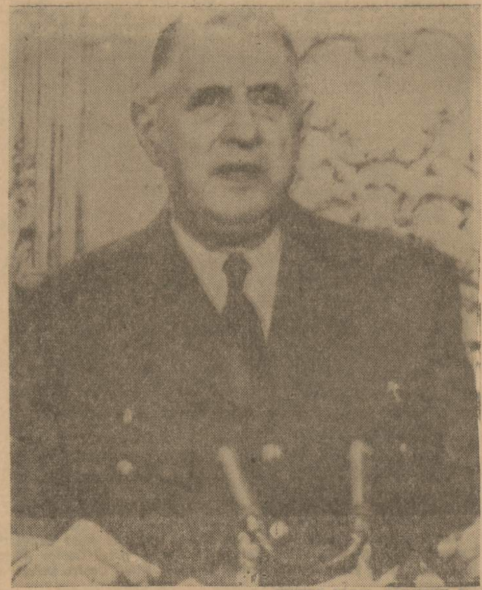
Prancūzijos prezidentas Charles DeGaulle, kalbėdamas per radiją ir televiziją, pareiškė, jog jis pasiilmas visą krašto valdymo galia, kad galėtų likviduoti sukilimą Alžire.

MELROSE PARK, ILL. Pereitą sekmdienį, balandžio 23 d., įvyko tikrai nepaprastas A. L. Bendruomenės susirinkimas. Probish svietainėje buvo net perpildyta žmonėmis, jog net kėdžių pritrūko. Kad ir geriausioje organizacijoje yra reta, kai atsilanko į susirinkimą 70 nuošimčių narių. Šis susirinkimas