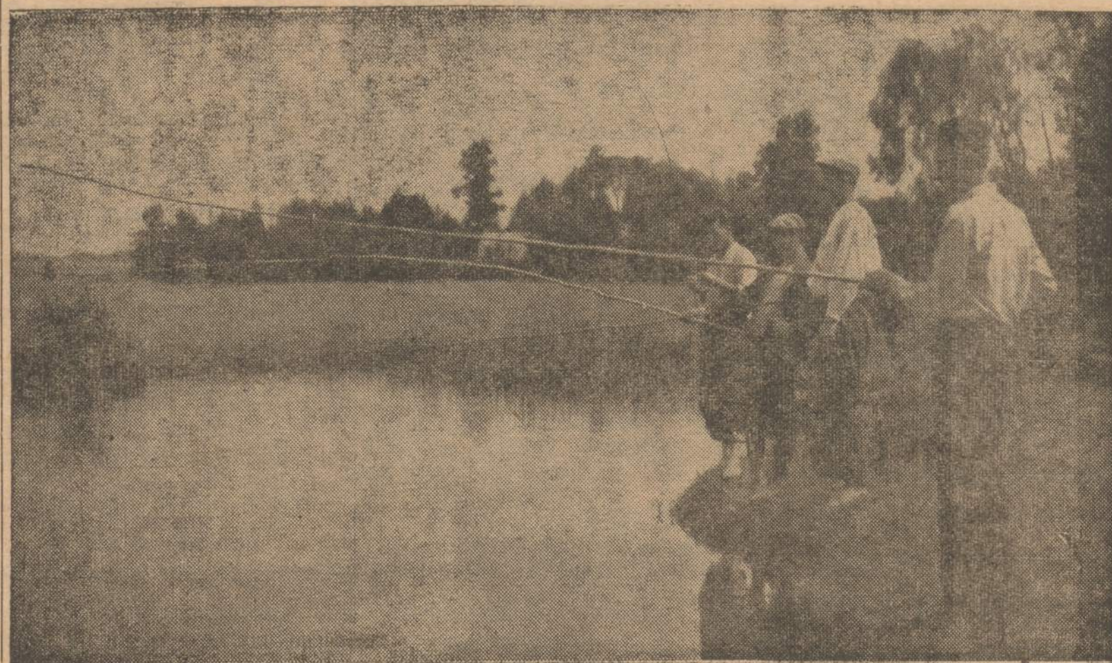
SMAGU IR GERA PAŽVEJOTI EŽERE