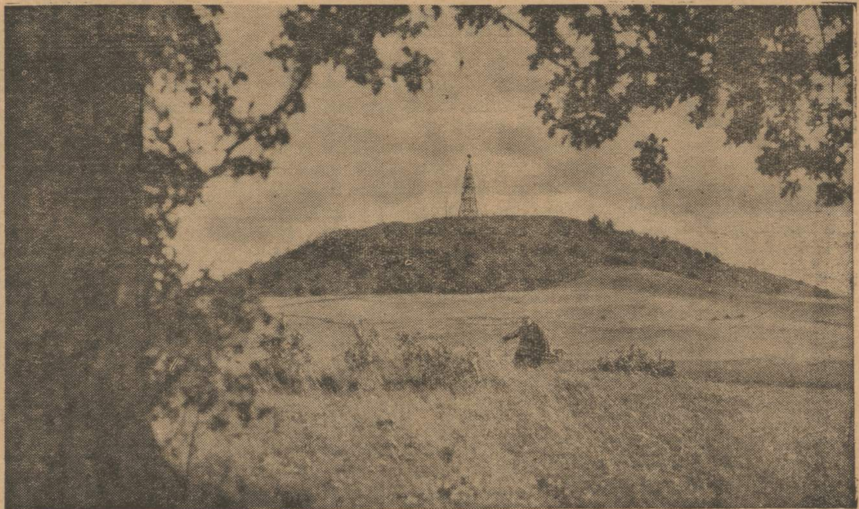
GARSUSIS ŠATRIJOS KALNAS. JIS SLEPIA DAUG GRAŽIŲ PDAVIMŲ APIE DIDINGĄ LIETUVOS PRAEITĮ

12 — NAUJIENOS, CHICAGO 8, ILL. — SATURDAY, APRIL 29, 1961