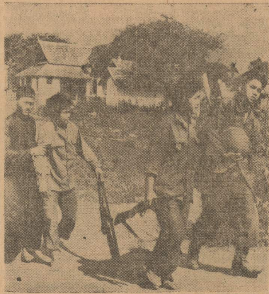
Laoso armijos slaugė (dešinėje) su šautuvu apsiginklavusi ir kita (kairėje) slaugės pagalbininkė, padeda sužeistoms Laoso kareiviams evakuoti iš priešų gresiamos srities.

— Kaip jau minėjau išrinkti reikia 31. Gi šiems rinkimams penkiose Apygardose — Los An-