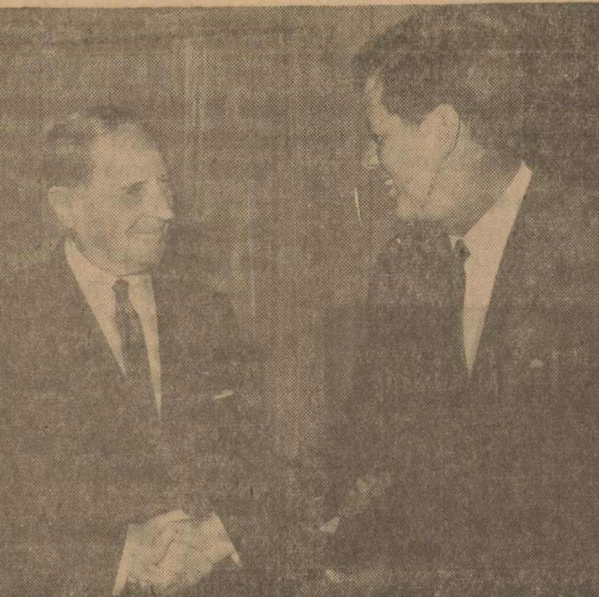
Prezidentas Kennedy, prieš atskrisdamas į Chicago, New Yorke pasimatė su buv. prezidentu Herbert Hooveriu, ambasadorium Jungt. Tautose Adlai Stevensonu ir aplankė generola Douglas MacArthurą jo Waldorf Towers apartamente.