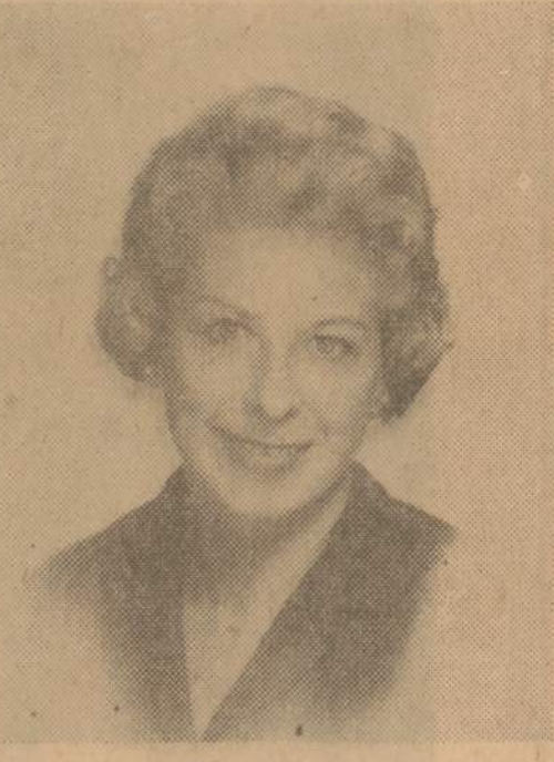
Kasmet Chicagos State Street Taryba išrenka daugiausia atžymėjusias moteris, kurios savarankiškai tarnauja prie įvairių "Voluntary Agencies".

Laimėjo pažymėjimą už savanorišką tarnybą