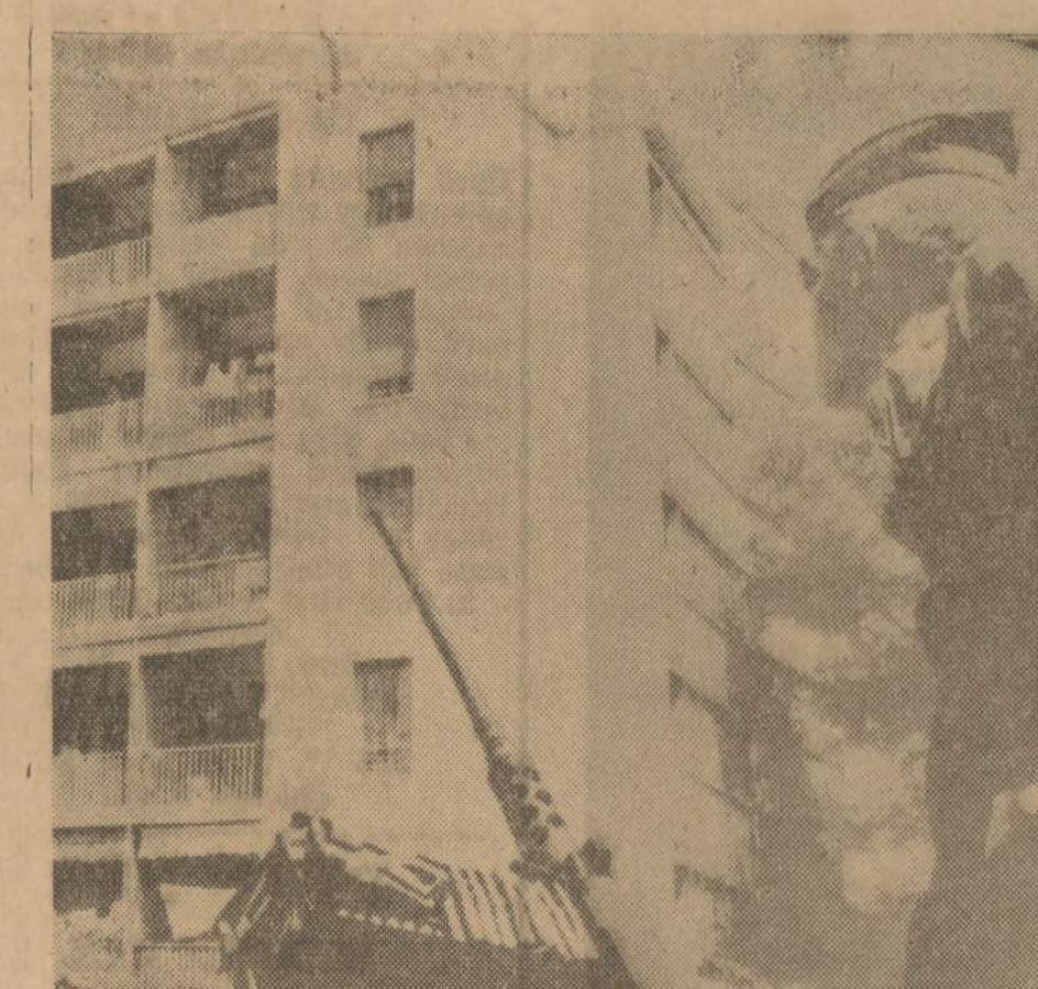
Vienas kareivis stovi prie paruošto šauti kulksvaidžio, kai kiši suėję į namus ieško sukiltėlių vadų ir jų paslėptų dokumentų Aizire, kurį sukiltėliai bando išlaikyti prancūzišku.