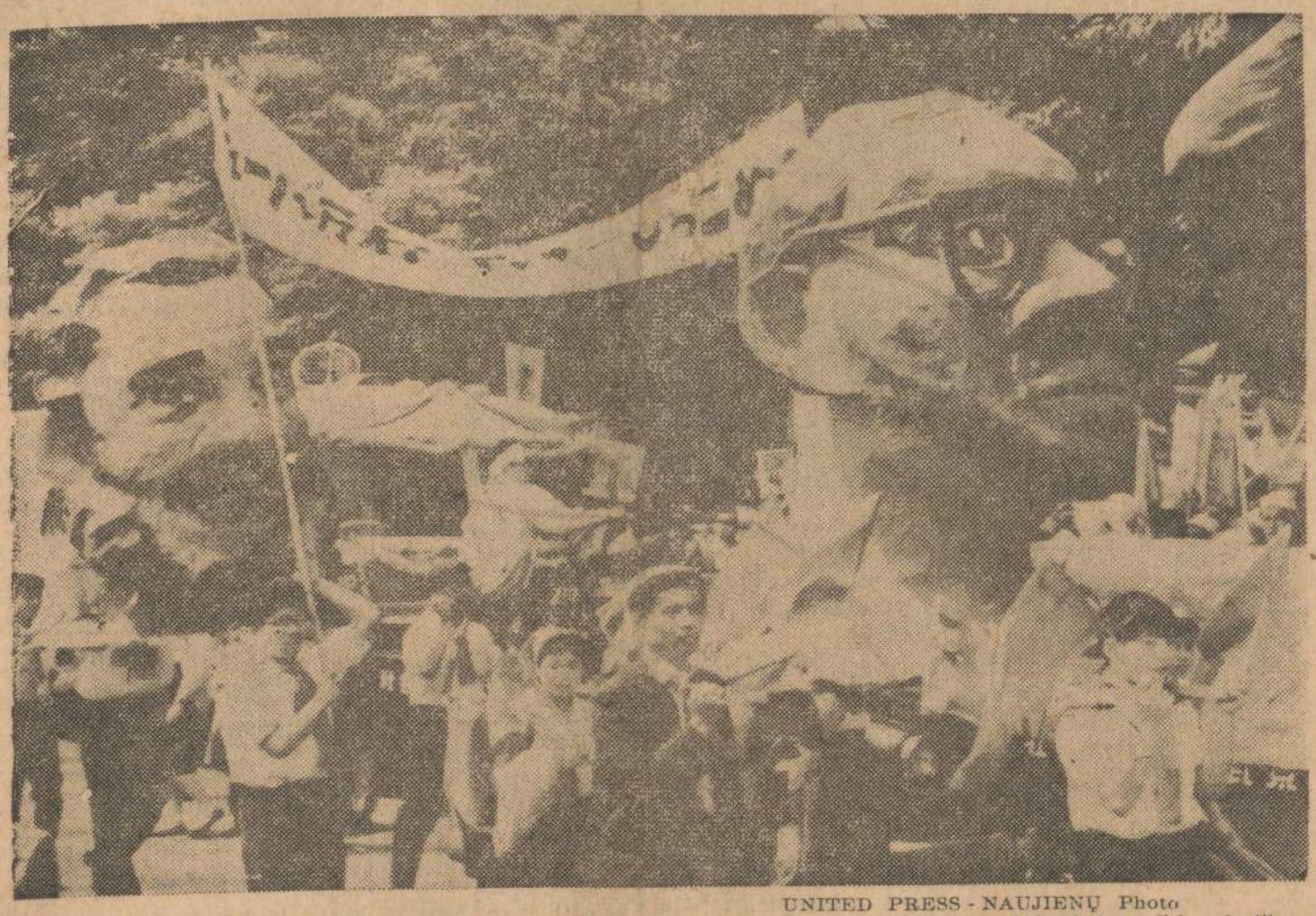
Milžiniškas Gegužės 1-sios paradas Japonijos sostinėje, Tokyje. Parado dalyviai, nešdami iš po- pieriaus padarytas Fidel Castro (kairėje) ir Raul Roa galvas, šūkavo, kad Japonija turi atnaujinti diplomatinis ryšius su komunistų valdoma Kinija.