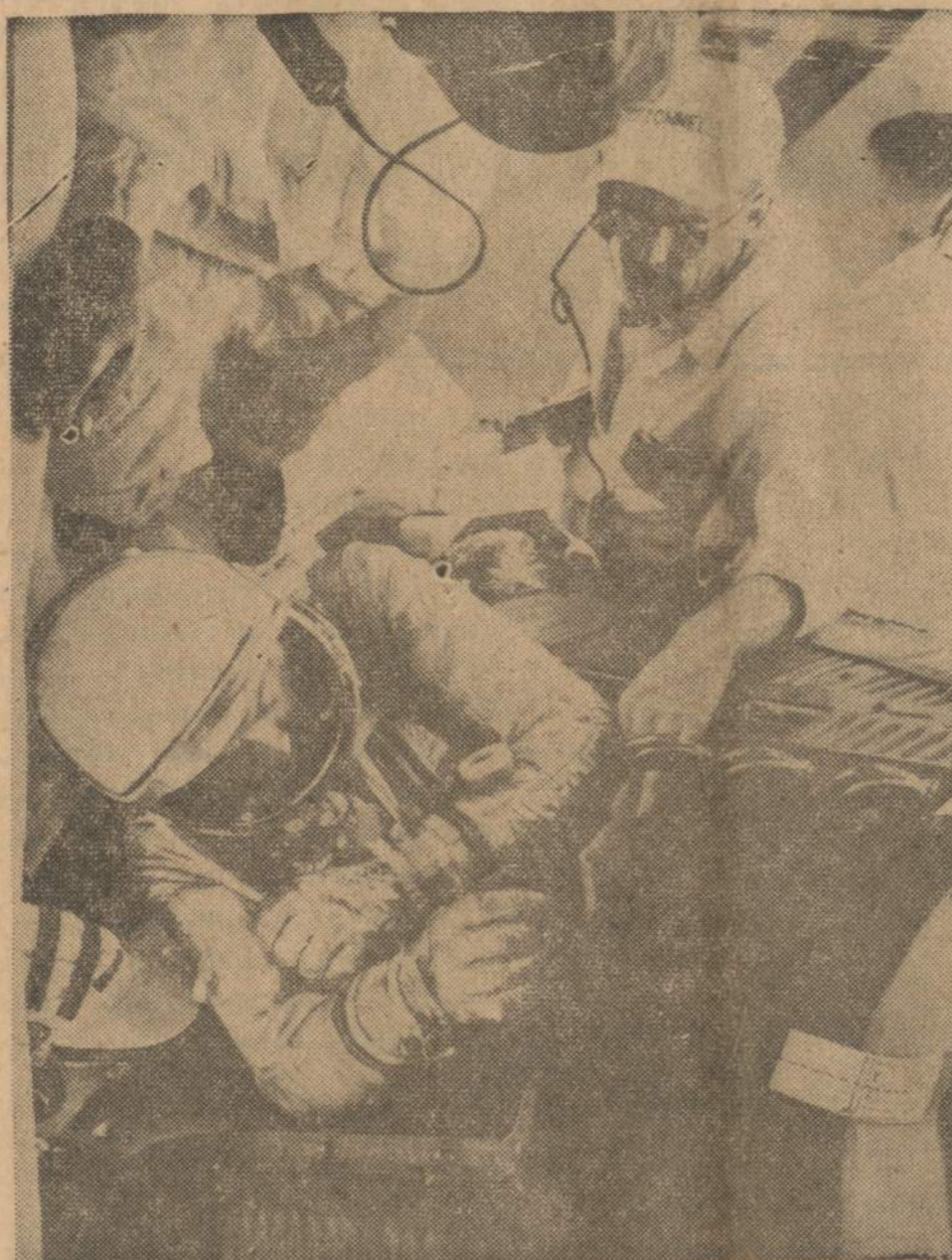
Astronautas Alan Shepard, kurs praėjusį penktadienį sėkmingai atliko pirmąją laisvojo pasaulio erdvėje kelionę, valdelyje matomas raudone raketė iš Cape Canaveral. Ilipant į Mercury kapsulę per paskutinį bandymą prieš išsautant

— Robert Kennedy, vyr. prokuroras, buvo atvykęs į Chicago pasakyti kalbą lenkų masiniame susirinkime, minint konstitucijos dieną. Vyresnioji Kennedžių sesuo yra ištekėjusi už lenkų kunigaikščio Radvilos, gyvenančio Londone.