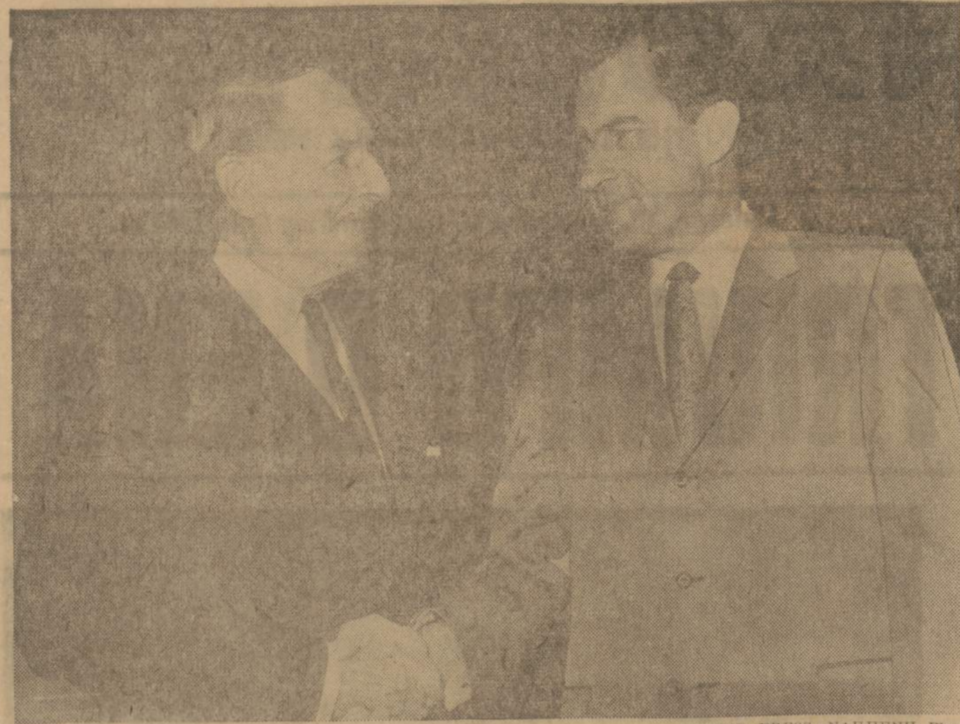
Buvęs viceprezidentas Richard Nixon sveikinasi su generolu Douglas MacArthur New York'e. Prieš atvykdamas į Chicago pasakytį savo pirmąją opozicinę kalbą, Nixon pareiškė, kad jis "nesisirasius po praistį", o pateiks konstruktyvių patarimų ateičiai.

Ar nelygiai tokiomis pat darbo ir aprūpinimo (lėšų atžvilgiu) sąlygomis dirba mūsų ginklo broliai "Ramovėnai", kurie, štai, per trumpą laiką sugebėjo suplanuoti, suorganizuoti medžiagas ir lėšas, susitarti su menininkais ir darbininkais specialistais ir pastatyti žuvusiems dėl Lietuvos laisvės ir nepriklausomybės paminklą. Visai, manau, daugiau laiko pareikalavo, negu kelių šimtų laišku atspaudinimas. Arba štai organizuojama dainų šventė, Lietuvos Fondas... Kaip Tamstai atrodo: ar anie organizatoriai, visuomenės veikėjai, turi specialius rūmus, kadruos ir priemones bei lėšas tiems svarbiems darbams vykdyti? Ar jie gauna mokslintais tarnautojų — darbininkų kadrais, specialiom darbo priemonėmis, kaip L. B. M. ma-