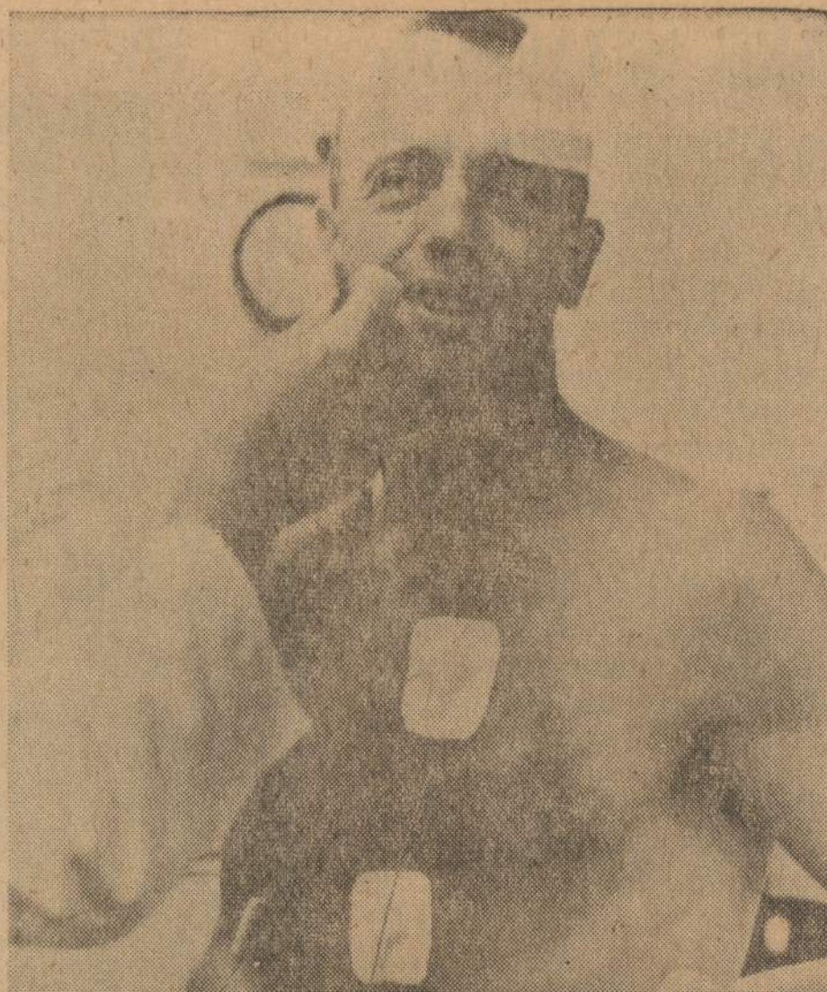
Astronautas Alan Shepard šypsosi, kai prie jo kūno yra pritaisomi elektrodai, kad rekorduotų įvairias jo kūno funkcijas skridimo metu. Pats didžiausias greitis skridimo metu buvo užkorduotas 5,100 mylių per valandą.

AND LOAN ASSOCIATION 1447 S. 49th COURT, CICERO 59, ILL./BI 2-1397, TO 3-8131