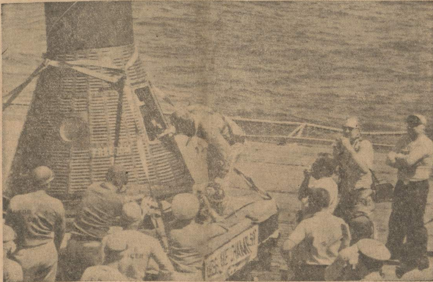
Astronautas Alan Shepard žiūri į Mercury erdvės kapsulę, kurioje jis atliko savo kelionę. Kapsulę ir patį Sheparda ištraukė iš jūros helikopteriai.

"Jei anglai padės afrikiečiam išvartyti baltuosius iš Rodezijos, Niasalando, bus išvartyti anglai