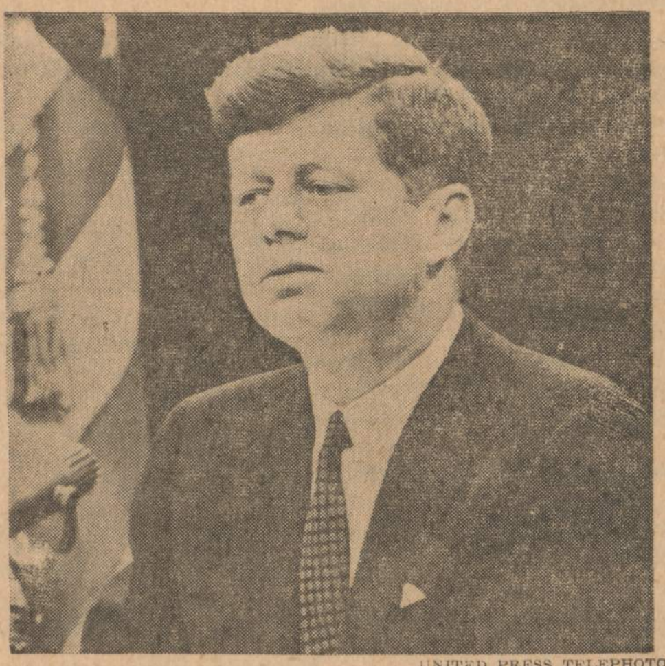
Prezidentas Kennedy spaudos konferencijoje pareiškė, jog jis rimtai galvoja apie pasiuntimą Amerikos karo jėgų į Pietų Vietnamą, jei komunistai nesiliaus brautis į tą kraštą, kad galėtų jį pavergti.

DEL SIUNTINIŲ Į LIETUVĄ Labai dažnai žmonės daro klaidas ir siunčia ne tai, ką reikia siųsti. Prieš sudarydami siuntinį, pasitarkite su mūsų prityrusiais tarnautojais, kurie teisingai patars, ką siųsti ir ko nesiųsti. LIETUVIŲ KOMPANIJA WORLD PARCEL SERVICE 3320 SO. HALSTED ST. CHICAGO 8, ILL. YA 7-0677