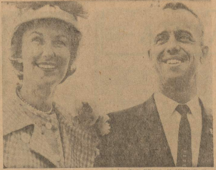
Astronautas Alan B. Shepard ir jo žmona Louise buvo pagerbti Baltuosiuose Rūmuose prezidento Kennedy ir jo žmonos.