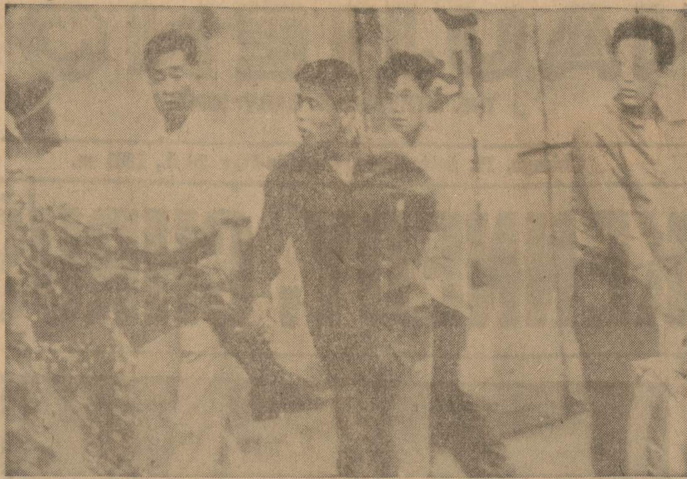
Pietų Korėjoje sukilo armija ir nuvertė valdžią be jokių rimtesnio pasipriešinimo. O kas bandė pasipriešinti, tai buvo apspardyti, kaip matosi iš šios nuotraukos. Ši nuotrauka buvo nuimta Seoul mieste, Korėjos sostinėje.

suvažiavime tuo opiu klausimu jokių nuosprendžių nepadarėta. Šitokioje atmosferoje neįmanoma jokia sportinė statistika, joks nuostatų derinimas. Dar pabaigai reikia priminti, kad šių metų žaidynėms laukiama tvirtų lengv. atl. varžybinių nuostatų, naujų lengv. pakelimų, kurie praicitais metais Romoje nutarti ir vispusiškai susitvarkymo aikštėse, halėse, visoje administracijoje ir užimamose pareigose. Toliau eiti šunkiaus greičiu, nesidomint būtiniaisiais esminiais klausimais ir atsakomybe, nedera.