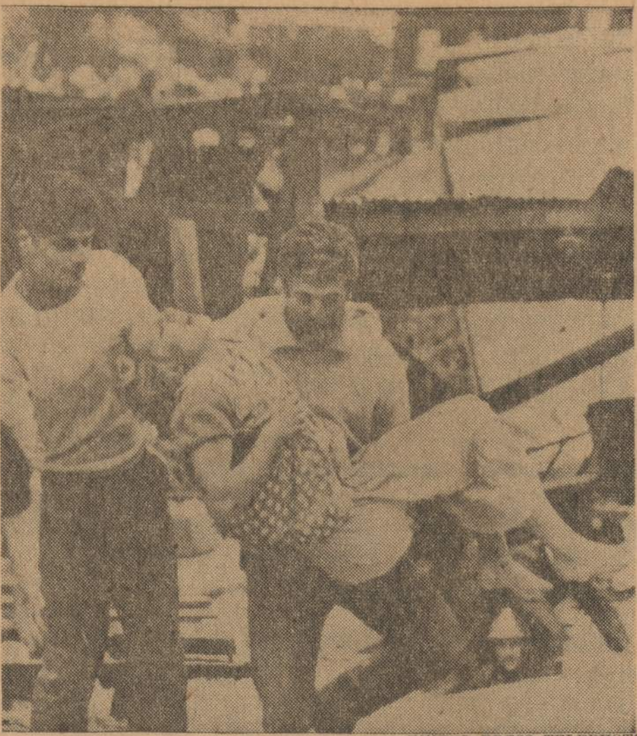
Paryžiaus priemiestyje Clamart dėl slenkančios žemės visame kvartale sugriuvo namai. Kiek žmonių nukentėjo, — tikrai dar nėra žinoma. Čia parodoma viena tos nelaimės auka, būtent moteris, kuri buvo sužeista ir iš griuvėsių ištraukta.

Petrogrado (dabar Leningradas) ir jo apylinkių oras — klimatas, ypač žiemos metu, yra labai šaltas ir drėgnas, tad turintys neperstiprius plaučius, tuoj pradeda stipriai kosėti ir pajunta krūtinėje skausmą. Aš irgi po kurio laiko pradėjau kosėti, todėl bendrabučio vedėjas pasiuntė mane ir dar porą mo-