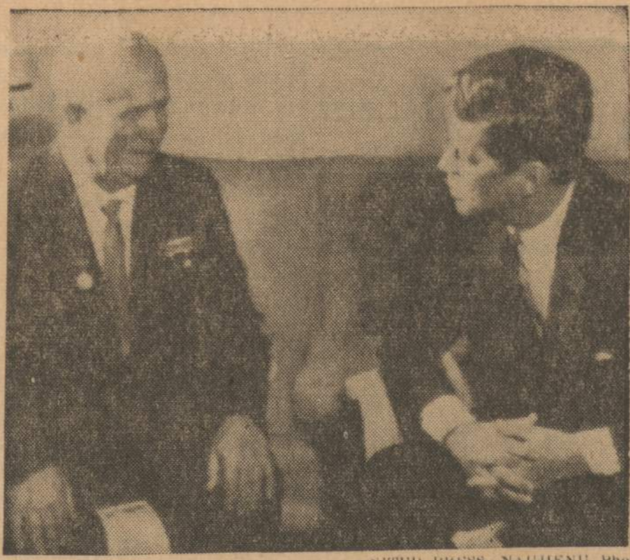
Prezidentas Kennedy ir Sovietų premjeras Nikita Chruščiov Vienuoje. Per dvi dienas jie pasikalbėjimuose praleido 15 valandų.

Užtat kai sovietinė propaganda stengiasi užliūliuoti laisvojo pasaulio visuomenę, kai spaudoj nuolat skaitoma apie nacinės Vokietijos darytus nusikaltimus, sustabdytus jau prieš šešiolika metų, o retai užlinkame žinių, vaizduojančių šiandieninį komunistinį terorą, turime daryti visa, kas nuo mūsų pareina, kad laisvojo pasaulio spauda, radijas, televizija nuolat primintų, jog yra nemaža dalis pasaulio, kur