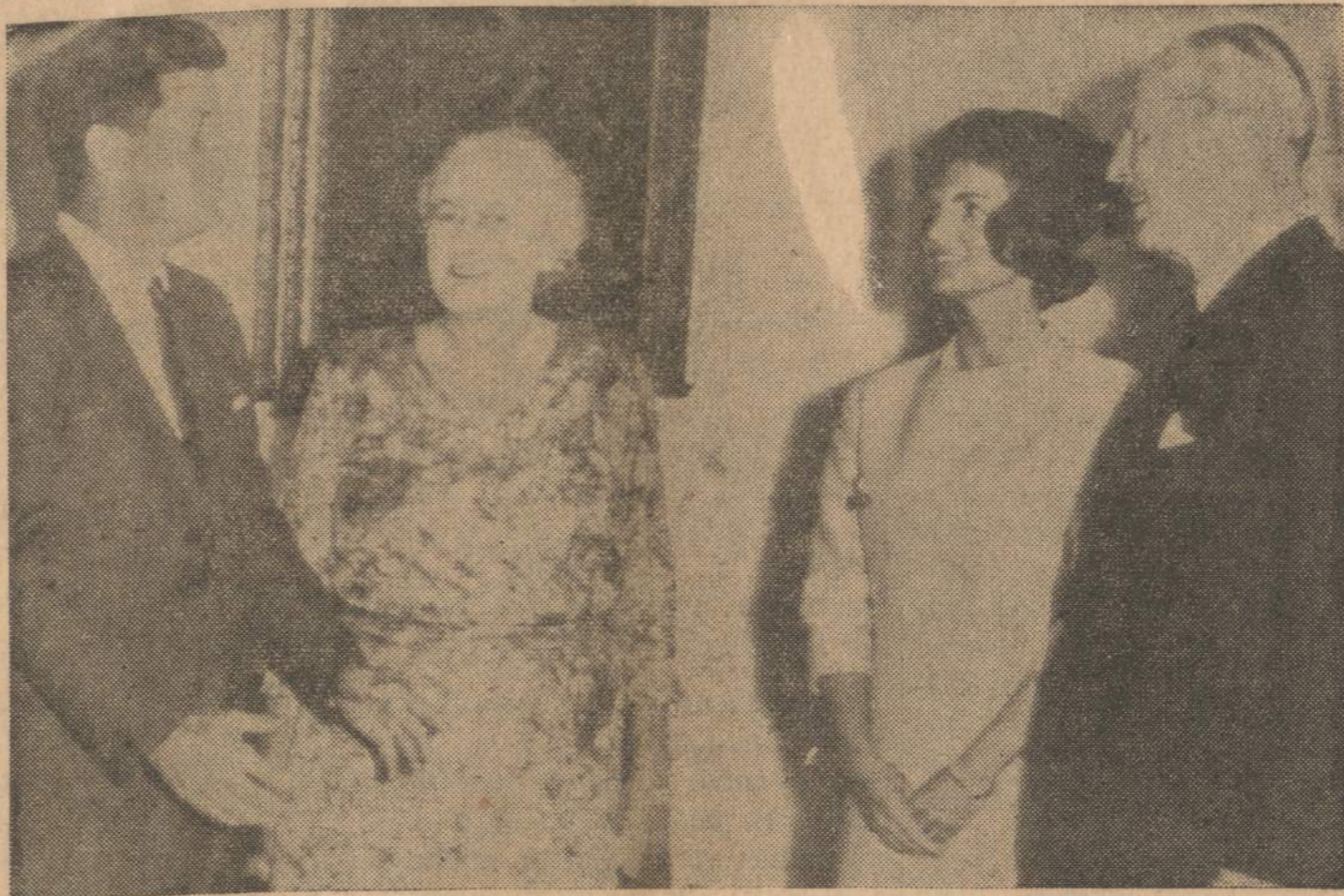
Prezidentas Kennedy ir žmona Jacqueline kalbasi su Anglijos premjeru Harold Macmillan ir jo žmona.