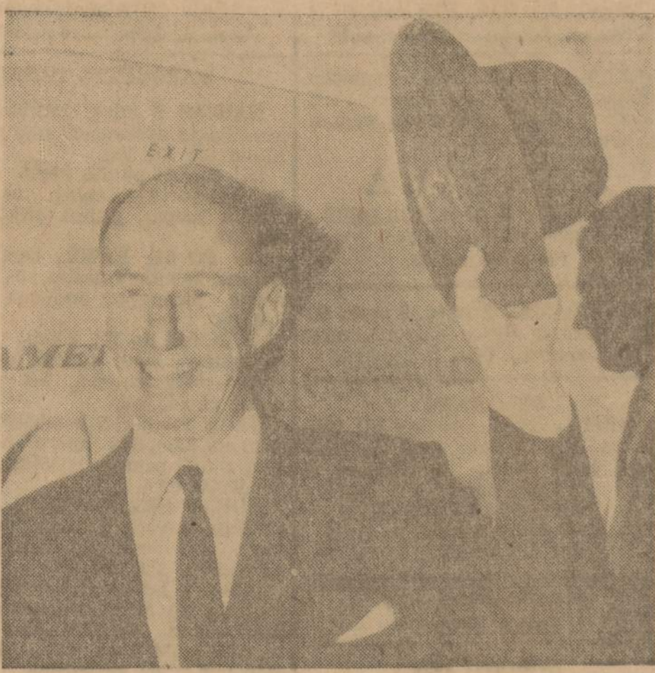
J. T. ambasadorius Adlai E. Stevenson regiasi eiti New York'e į spausdinį lėktuvą, kuriuo jis išskris į Caracas, Venecuela. Pietų Amerikoje jis aplankys dešimt valstybių.

Tel.: HEMlock 4-2413 7159 SO. MAPLEWOOD AVE. CHICAGO 29, ILL.