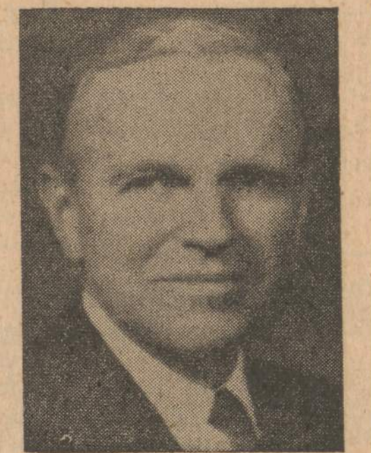
Roswell L. Gilpatric, gynybos sekretoriaus padėjėjas, pareiškė, jog Vakarų valstybės Europoje, reikalui esant, panaudos ir branduolinius ginklus. Tai je darytų tuo atveju, jei komunistų galingsnės jėgos pradėtų brautis į Vakarų Europą.

Kalbėtasi Vienoje mandagiai, šaltai, be grasymų ir ultimatumų. Pokalbiai buvę naudingi abiem pusėm. Aš buvau skaitęs jo politines kalbas, pasakojo prezidentas tautai, aš buvau su pažindintas su jo pažiūromis. Aš buvau girdėjęs apie jį iš kitų Vakarų vadų — De Gaulle, Adenauerio, Macmillano, kokio būdo jis yra. Bet man, kaip JAV prezidentui, reikia daryti sprendimus, kurių negali už mane atlikti joks patarėjas, joks sąjun-