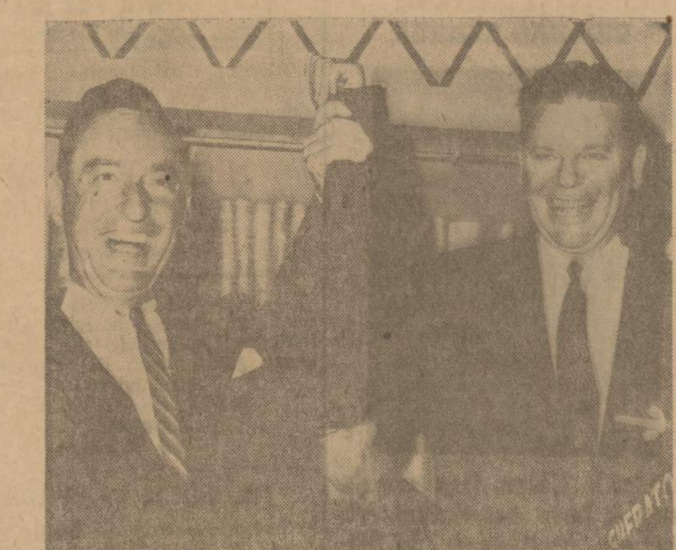
Sen. Thurston Morton (dešinėje), pasirašantis už komiteto pirmininko pareigų, pristato savo vieštininką, William E. Miller.