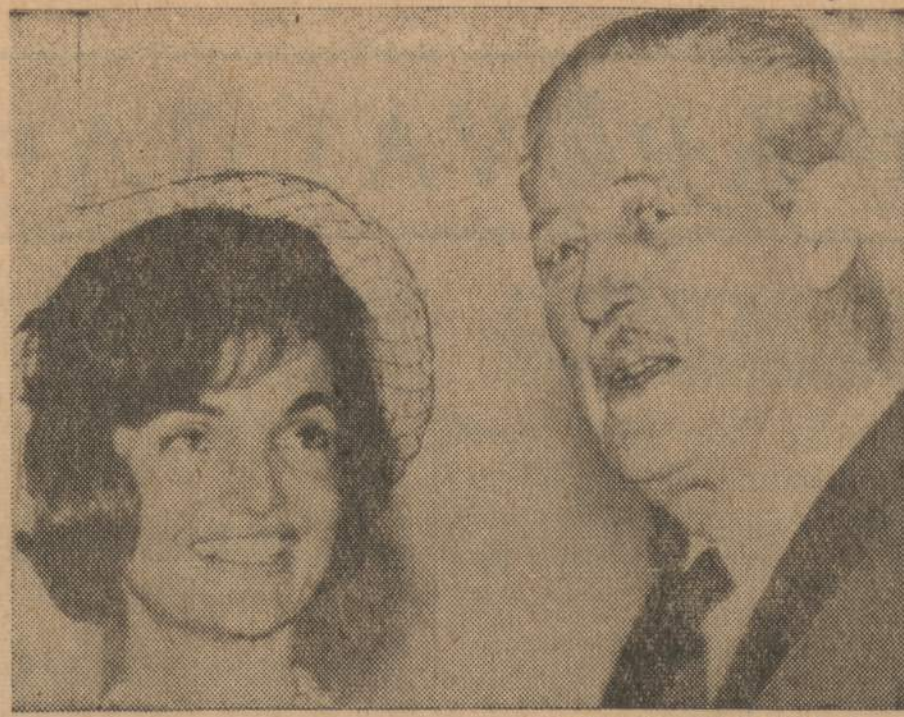
Jacqueline Kennedy ir Anglijos premjeras Macmillan admiralicio rūmuose, kur Macmillanai surengė prezidentui ir jo žmonai priėmimą.