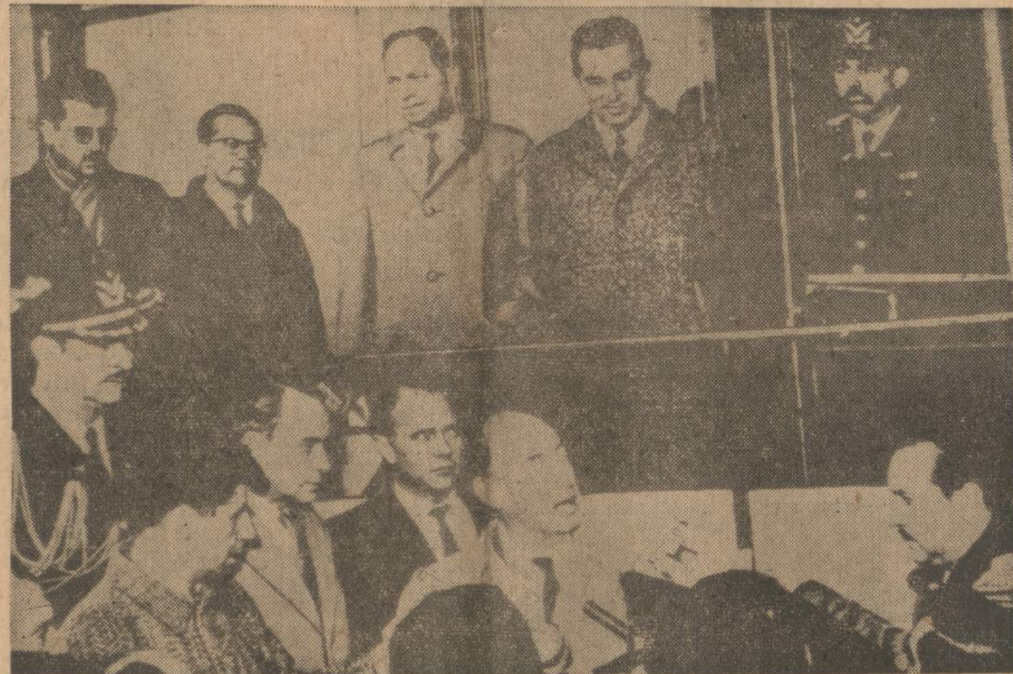
Adlai Stevenson, Amerikos ambasadorius Jungtinėms Tautoms, pasakė trumpą kalbą, atvykęs į Santiago, Čilės valstybę. Tą pačią dieną prie Amerikos informacijos agentūros įvyko kairiųjų studentų demonstracija.

CIUDAS TRUJILLO, Dominika. — Slaptoji policija, veikianči nacių ir komunistų išbandytomis metodais, areštuoja vis daugiau kariškių, įtariamų dalyvavimu diktatoriaus Trujillo nužudyme. Vienas generolas nusišovė, pamatęs pro langą, kad atvažiavo policija jį areštuoti.