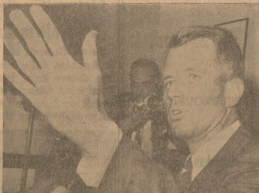
Spaudos konferencijoje generalinis prokuroras Robert Kennedy pareiškė, kad vėtrė kova su nusikaltimais apsupkna tas faktas, kad daugeliui amerikiečių rūpi vien tik įsigijimas didesnių televizijos aparatų, didesnių automobilių ir greitesnis praturėjimas.

4 — NAUJIENOS, CHICAGO 8, ILL. — SATURDAY, JUNE 17, 1961