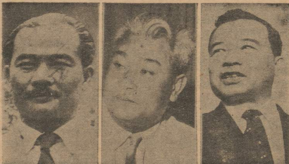
Laoso princų konferencija. Buves Laos premjeras Souvanna Phouma (dešinėje) pareiškė, jog į koalicinę vyriausybę negalės įeiti Vakarų remiamas premjeras Boun Oum (viduryje). Tačiau komunistų remiamas sukilėlių vadas Souphanouvong (kairėje) užimšias svarbią vietą koalicinėje vyriausybėje.