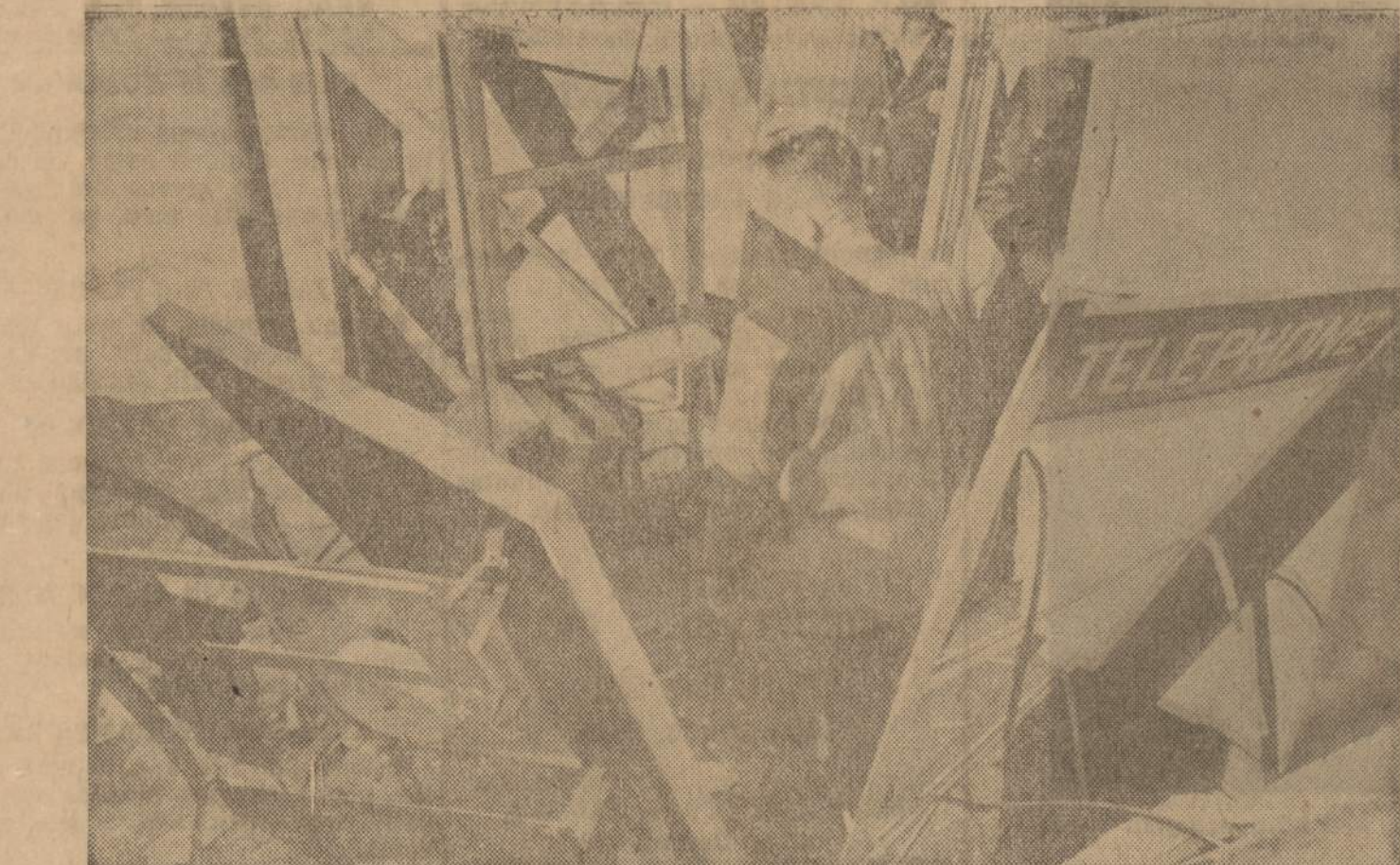
Defektivas Washingtono mieste tyrinėja telefono būdelę, kurioje sprogo kažkieno padėta bomba. Prieš tai kita bomba sprogo Veteranų Administracijos atmatų dėžėje. FBI gavo telefonu pranešimą iš kažkokio integracijos priešo, kuris pasisakė šešias bombas išdėliojęs Washingtono.

Tel.: HEMlock 4-2413 7159 SO. MAPLEWOOD AVE. CHICAGO 29, ILL.