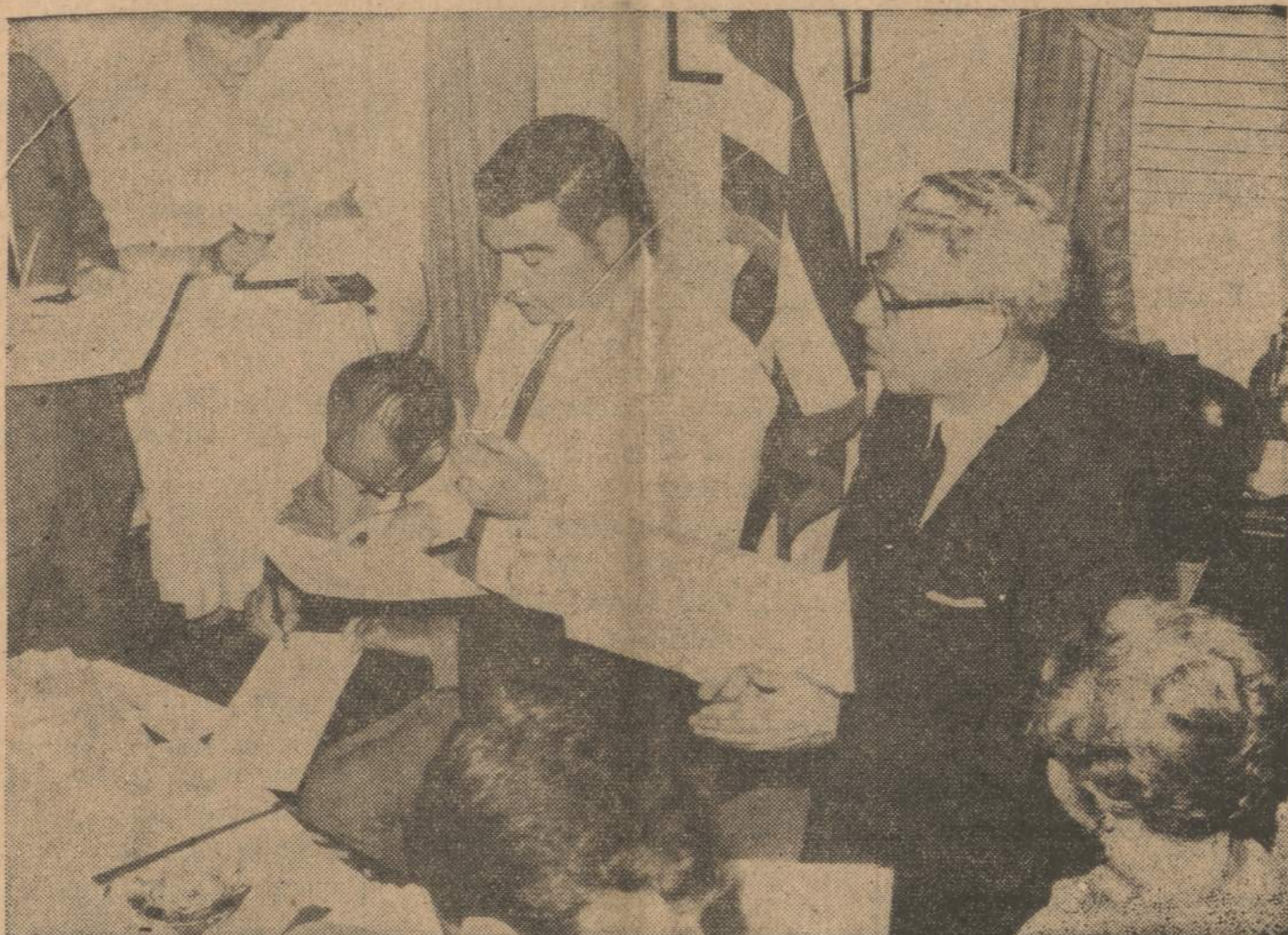
Darbo sekretorius Arthur Goldberg (dešinėje) Baltuosiuose rūmuose praneša spaudos atstovams, kad prezidentas Kennedy paskelbė įsakymą, pagal kurį bus panaudotas Taft-Hartley įstatymas ryšium su laivų krovėjų streiku.

Šia tema į dieną anksčiau ginčijosi televizijos programoje su Baltųjų rūmų spaudos sekretorium Pierre Salinger ir buvusiu New York Times korespondentu New York Harrison Salisbury.