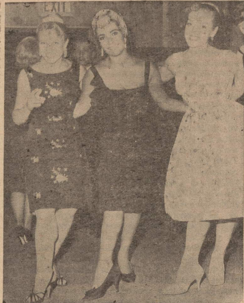
Filmų aktorė Elizabeth Taylor (viduryje) šoka su rusu Moisejevo baletu nariais pobūvyje, kurį surengė ji ir jos vyras Eddie Fisher. Pobūvyje dalyvavo 100 Moisejevo baletu narių.