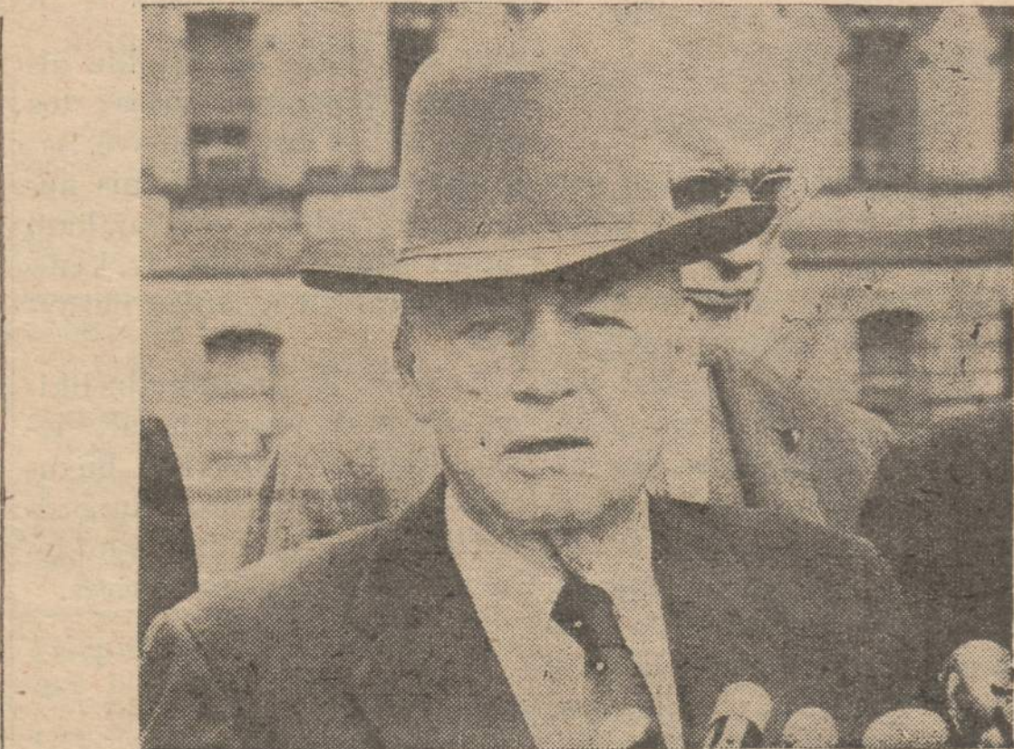
Kongreso pirmininkas Sam Rayburn, po pasimatymo su prezidentu Kennedy, spaudos atstovams pareiškė, jog kongresas švietimo bilijū priims.

Antanas Škėma, kuris pats yra produktyviausias išeivijoje dramatinės literatūros autorius, Tabor Farmos suvažiavime skaitys paskaitą apie "Išėjimo teatro problemas". Savo teatine programa šiemetinis suvažiavimas įsikūnys į jau nemažą eilę studentų santariečių suvažiavimų, kuriuose buvo atkreiptas gyvas dėmesys į scenos meną.